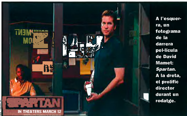
A l'esquerra, un fotograma de la darrera pel·lícula de David Mamet: Spartan . A la dreta, el prolífic director durant un rodatge.