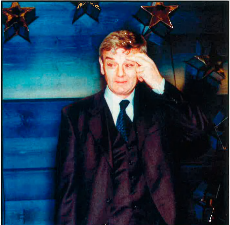
L'actual ministre alemany d'Afers Estrangers, Joschka Fisher, a la imatge de dalt, apareix als papers de l'anomenat procediment "verd". Encara avui ningú no sap com els serveis secrets i de defensa dels EUA (a sota, el Pentàgon, a Washington) aconseguiren microfilmar els arxius de l'Stasi.

La Bundesamt für Verfassungsschutz (Oficina Federal per a la Protecció de la Constitució, BfV), va prendre nota de