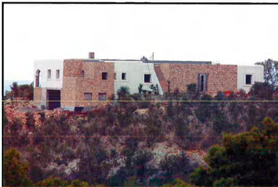
Dalt, l'espectacular edifici aixecat a sa Rota des Puig amb l'excusa d'ampliar-ne un altre del costat. A sota, una de les cases prefabricades que abunden a Eivissa i Formentera, que els propietaris diuen que equivalen a una caravana; la llei, però, especifica que cal una llicència.