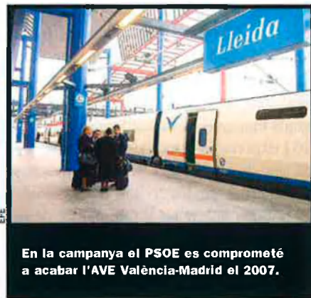
En la campanya el PSOE es compromet a acabar l'AVE València-Madrid el 2007.

Paral·lelament, al País Valencià no hi ha un debat intens sobre la reforma del model de finançament; l'única notícia que hi ha és un vague suport del secretari general del PSPV, Joan Ignasi Pla, al model proposat per Pasqual Maragall.