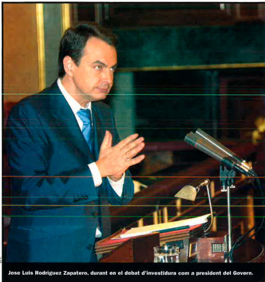
Jose Luis Rodríguez Zapatero, durant en el debat d'investidura com a president del Govern.

d'acord. Dit d'una altra manera: l'acord ha de ser entre PSOE i PP. Si no, no hi ha res a fer. D'aquí que Zapatero utilitzi les formes verbals en futur i de naturalesa voluntarista. Potser ho proposarà, però caldrà veure com treballa prèviament aquesta proposta. És senzillament impossible que d'un acord entre el PSOE i els nacionalistes –i eventualment IU– se'n pugui derivar una reforma que alteri el marc institucional actual. La Constitució en això és rotunda: només el consens entre les dues forces majoritàries –actualment socialistes i conservadors, abans la UCD i el PSOE, que foren les que pactaren el nucli constitucional– permet abordar un procés de reforma per al qual es requereix el vot afirmatiu de tot dos. Per si serveix de referència, històricament les constitucions espanyoles –al contrari d'altres estats– sempre han estat les menys reformades.