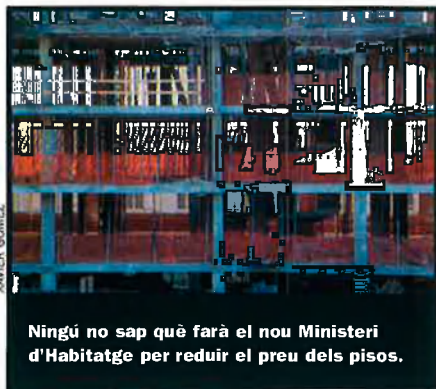
Ningú no sap què farà el nou Ministeri d'Habitatge per reduir el preu dels pisos.

La llei de qualitat de l'ensenyament, el Govern espanyol ha dit que la derogarà i en farà una amb el concurs dels sectors implicats. No se'n coneixen les línies.