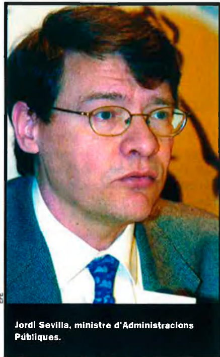
Jordi Sevilla, ministre d'Administracions Públiques.

Pel que fa al País Valencià, PP i PSOE han acordat per enèsima vegada la comissió que ha d'estudiar la reforma de l'Estatut. Mesos després que el PP frenés en sec les ànsies autonomistes del president Francesc Camps, ara sí que podria afavorir el procés de reforma estatutària.