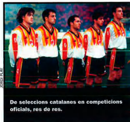
De seleccions catalanes en competicions oficials, res de res.

ció Canària. De les Illes, només els seus, quatre del PSOE. Hi ha voluntat genèrica d'atendre algunes peticions, però de compromisos fermes, concrets, no n'hi ha cap.