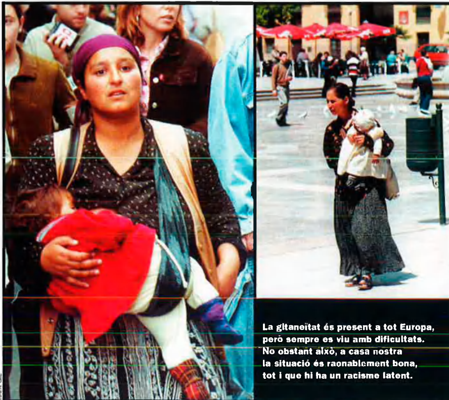
La gitanoïtat és present a tot Europa, però sempre es viu amb dificultats. No obstant això, a casa nostra la situació és raonablement bona, tot i que hi ha un racisme latent.