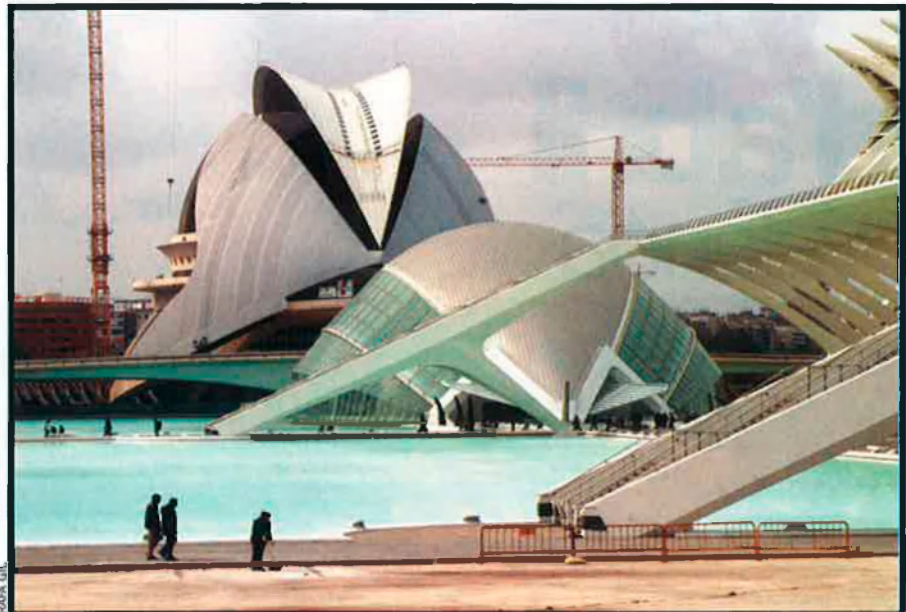
Vista general de la Ciutat de les Arts i de les Ciències amb el Palau de les Arts al fons. El futur auditori destinat a òpera ja costa, abans d'acabar-se de construir, 160 milions d'euros.