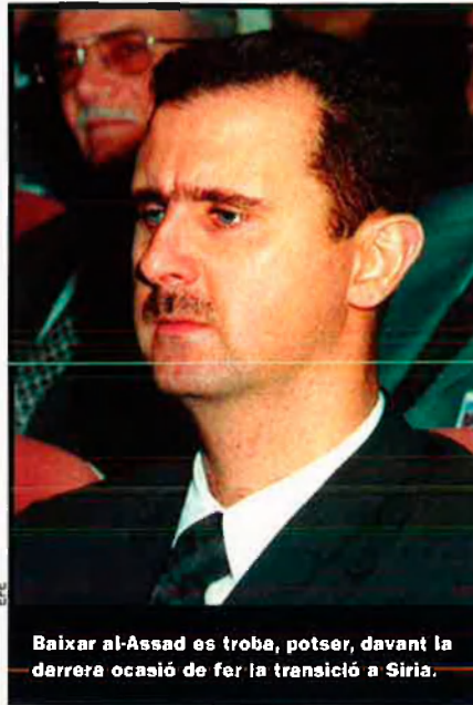
Baixar al-Assad es troba, potser, davant la darrera ocasió de fer la transició a Síria.

Els nord-americans acusen Damasc d'haver donat suport als iraquians durant la guerra i al terrorisme islamista. Així, segons l'administració Bush, desenes d'extremistes islamistes reclutats a Europa i entrenats a Síria van penetrar al nord de l'Iraq per posar-se a les ordres d'Ausar al-Islam, un grup lligat a al-