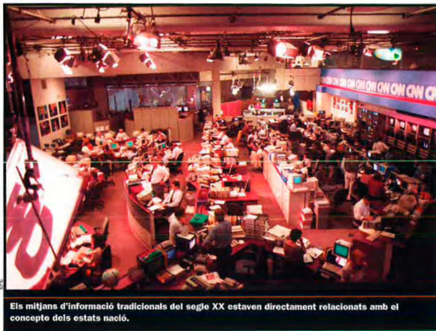
Els mitjans d'informació tradicionals del segle XX estaven directament relacionats amb el concepte dels estats nació.

pats o en vies de desenvolupament, ha fet que la televisió per satèl·lit esdevingui una finestra oberta per a molts ciutadans d'arreu del món. La generalització de l'ús d'Internet també s'ha convertit en un aliat per a la recepció i la difusió d'informació.