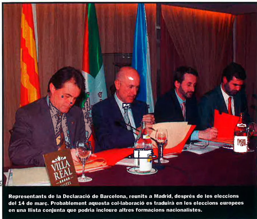
Representants de la Declaració de Barcelona, reunits a Madrid, després de les eleccions del 14 de març. Probablement aquesta col·laboració es traduirà en les eleccions europees en una llista conjunta que podria incloure altres formacions nacionalistes.

Més interrogants. Hi ha, però, diversos interrogants més pendents de resol-