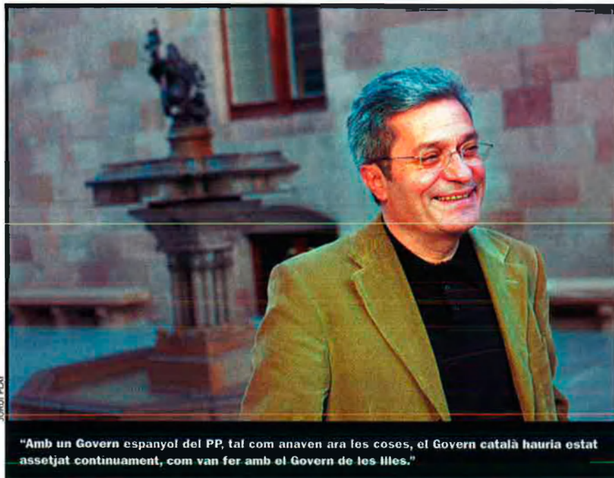
"Amb un Govern espanyol del PP, tal com anaven ara les coses, el Govern català hauria estat assetjat continuament, com van fer amb el Govern de les Illes."

Ara en sabem més que quan es negocià l'Estatut del 1979; nosaltres fèiem el pacte polític, però l'administració central posava la lletra petita. Avui, aquesta mateixa persona em deia: "Tenim la densitat més gran de persones expertes en dret constitucional per metre quadrat de tot l'estat espanyol." L'experiència acumulada ens ajuda. Sabem molt bé què volem, un Estatut blindat, que ha de tenir un cert caràcter constituent per a Catalunya, que especifiqui les normes bàsiques de l'autogovern i que no es puguin canviar per majories. També ha de significar, tant en el capítol de símbols i de llengua, un pas endavant. Crec que ho aconseguirem. Les altres comunitats demanaran el que voldran, però en tot cas, no acceptarem rebaixes del que considerem just en l'Estatut.