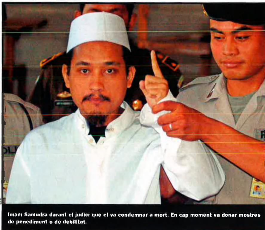
Imam Samudra durant el judici que el va condemnar a mort. En cap moment va donar mostres de penediment o de debilitat.

Si detesta els americans, als quals considera el sùmmum de la conspiració dels cristians, als quals anomena croats, i feu del sionisme internacional, com és que Bali va esdevenir un blanc? Al capítol “El perquè de la bomba de Bali”, Imam s'explica: “Una mica de pacièn-