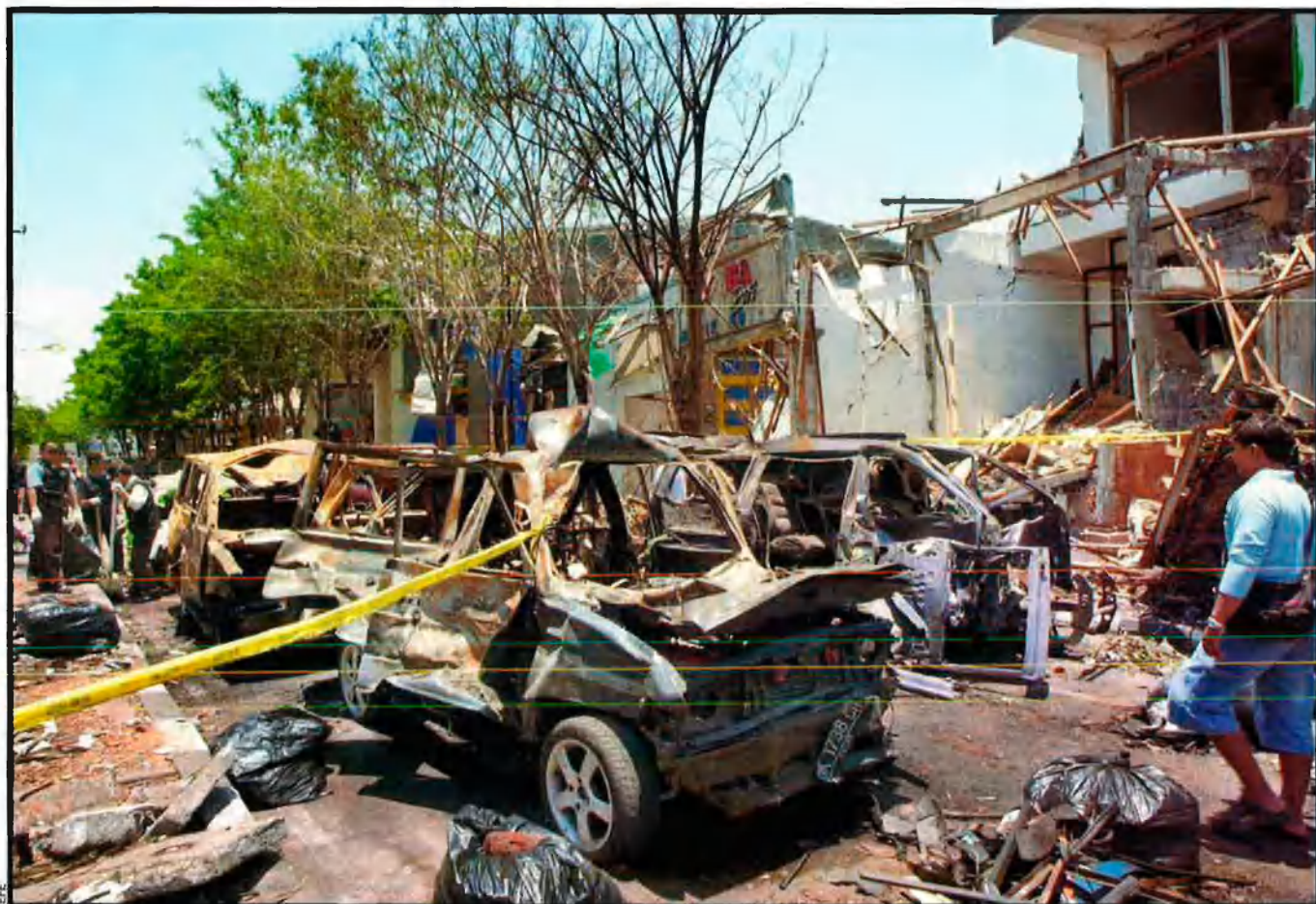
Conseqüències de l'atemptat que el 12 d'octubre del 2002 va provocar a Bali 202 morts, molts dels quals turistes estrangers. Imam va escriure que el seu objectiu no era Bali, sinó "els terroristes americans i els seus aliats que s'hi arreceren".

kistan, però a la vora de la frontera afganesa).