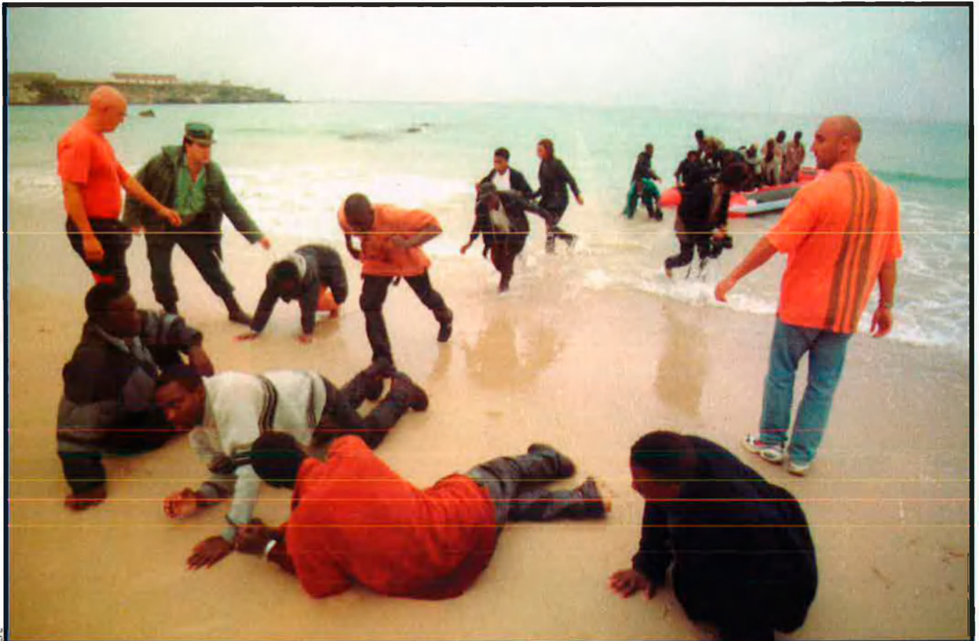
Arribada d'una pastera amb subsaharians indocumentats a Tarifa el 19 de juliol del 2000. Subsaharians i marroquins no acostumen a fer el viatge en pastera o zodiac junts, ni tampoc els preus d'aquest viatge són els mateixos: pels primers és molt més car que pels segons.