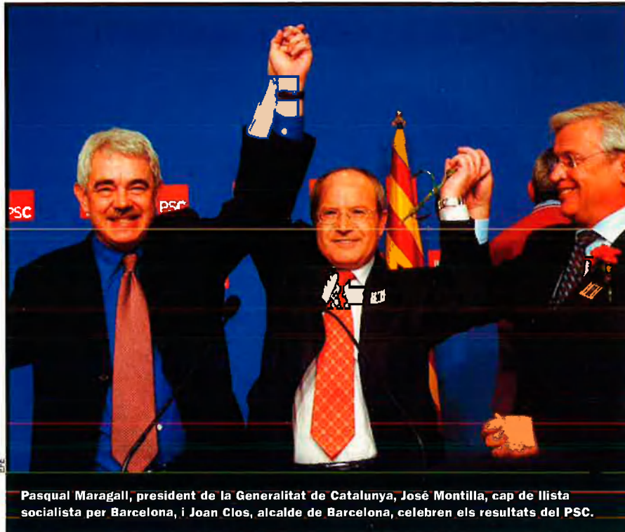
Pasqual Maragall, president de la Generalitat de Catalunya, José Montilla, cap de llista socialista per Barcelona, i Joan Clos, alcalde de Barcelona, celebren els resultats del PSC.