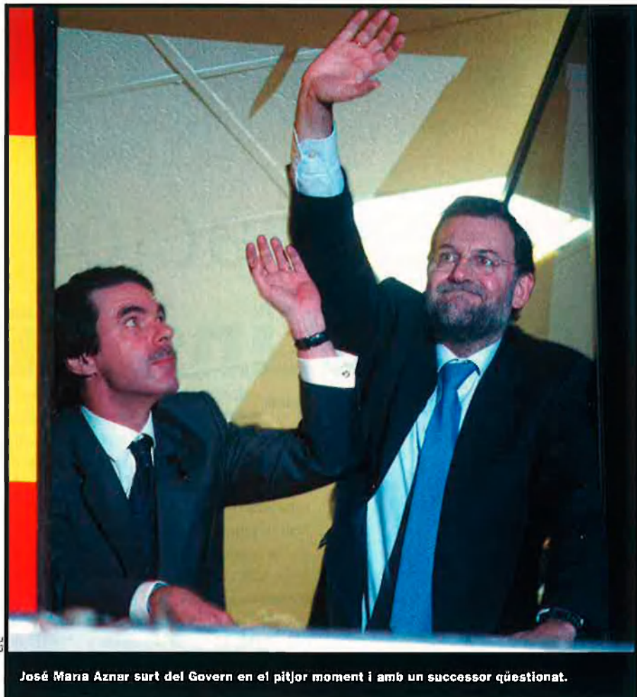
José María Aznar surt del Govern en el pitjor moment i amb un successor qüestionat.

Quant a les aliances per governar còmodament, els socialistes saben que la debilitat d'IU i la fragmentació del mapa els dona avantatge. Assajar, des de l'oposició, pines amb el PP en el cas de la mateixa IU, CiU o ERC seria un error polític vist el rebuig que els popu-