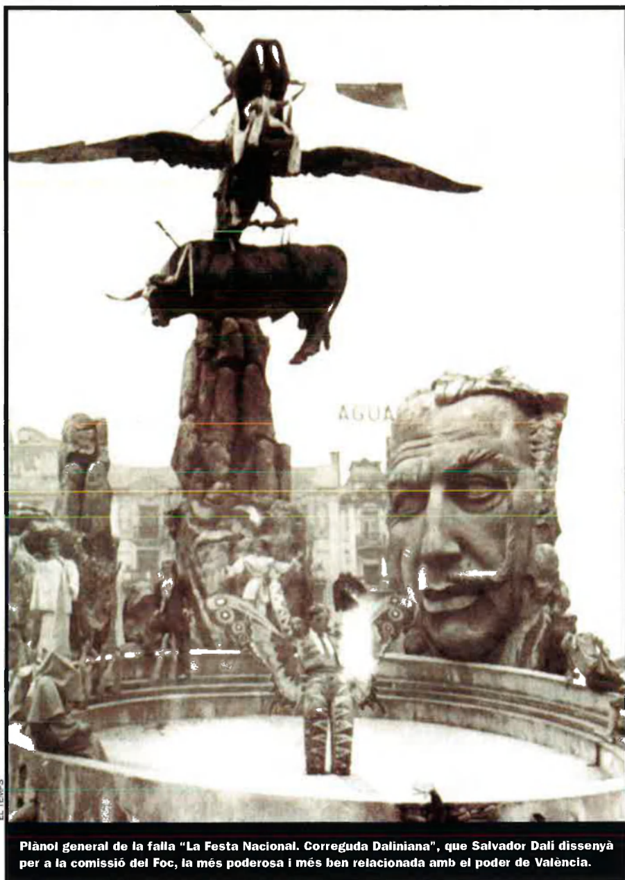
Plànol general de la falla "La Festa Nacional. Correguda Daliniana", que Salvador Dalí dissenya per a la comissió del Foc, la més poderosa i més ben relacionada amb el poder de València.

Mas va ser el creador i màxim exponent de l'estètica fallera naturalista, barroca, grotesca, caricaturesca i exagerada fins a l'extrem que es va instituir en els anys quaranta i que encara pre-