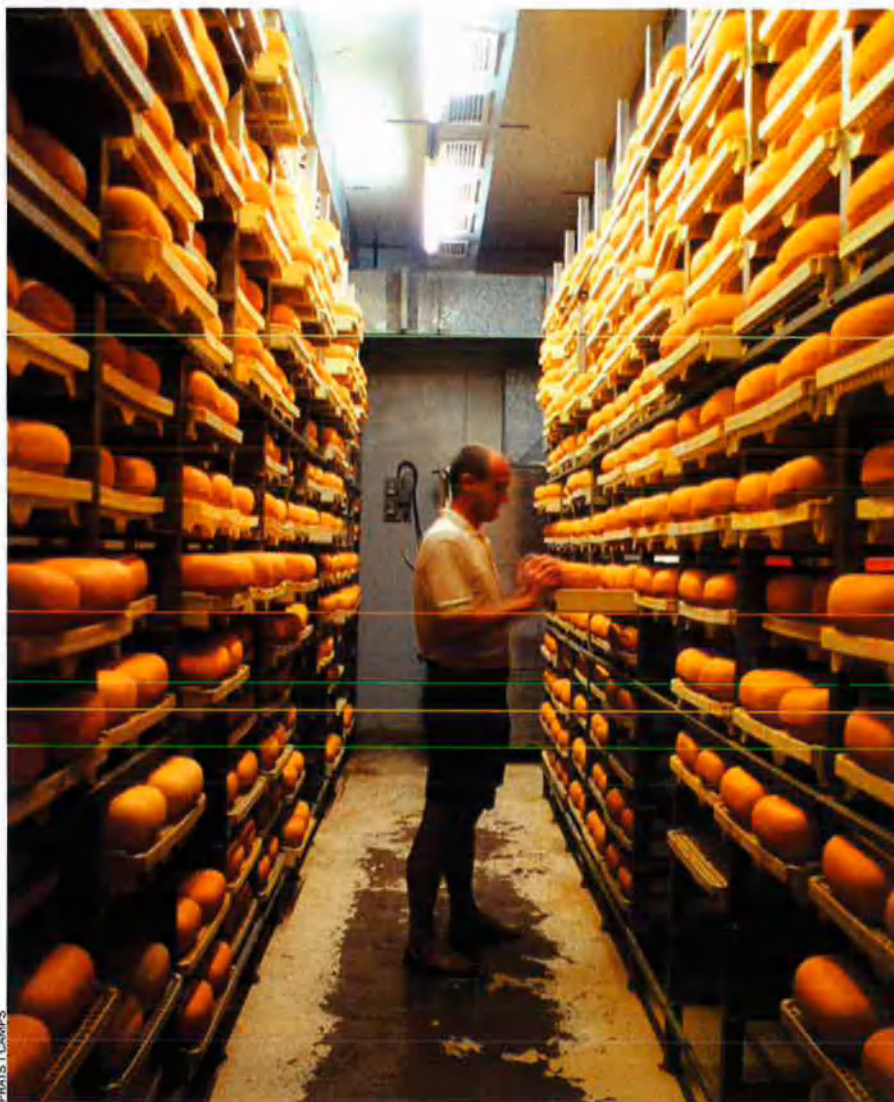
FRATIS I CAMPS

Amb vista al futur, els productors de Menorca han decidit apostar de valent per la comercialització del formatge amb denominació d'origen. De fet, el formatge autòcton es consumeix com a producte massiu i no com a producte de masses.