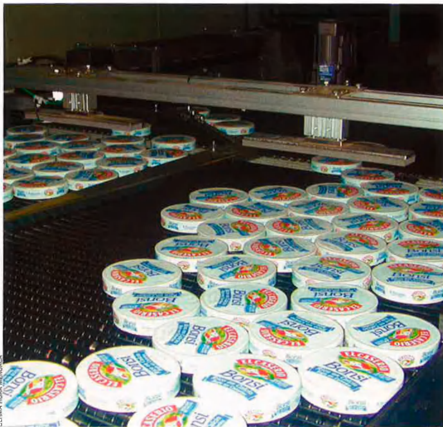
L'ÚNICA HOBA MENORCA