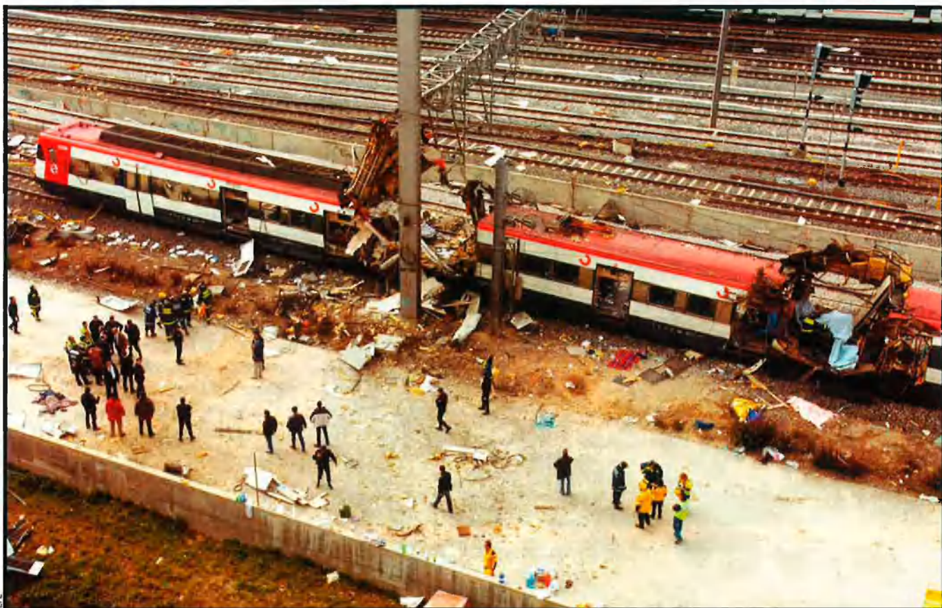
Imatges dels efectes del brutal atemptat contra la xarxa de trens de rodalia de Madrid, el passat 11 de març. La política exterior espanyola, amb la participació de la guerra d'Iraq, ha posat l'estat en el punt de mira del terrorisme integrista Islàmic.

en l'òrbita dels Estats Units d'Amèrica, sigui per tornar a l'europeisme abanderat per l'anterior Govern de Felipe González i dinamitat per José María Aznar.