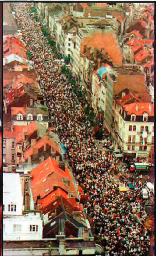
Junt aquestes ratlles, una imatge de Dutroux detingut per la policia i també una de les manifestacions que es varen celebrar a Bèlgica contra el paper que la policia i la judicatura desenvoluparen en el cas Dutroux.

pensar que tota la incompetència, la deixadesa i l'absurd que va ajudar Dutroux a actuar tan impunement era producte d'una conspiració que afectava totes les branques del sistema. De fet, gairebé el 70% dels belgues, apunta un sondeig publicat fa un parell de setmanes, creu que Dutroux pertany a una xarxa mafiosa.