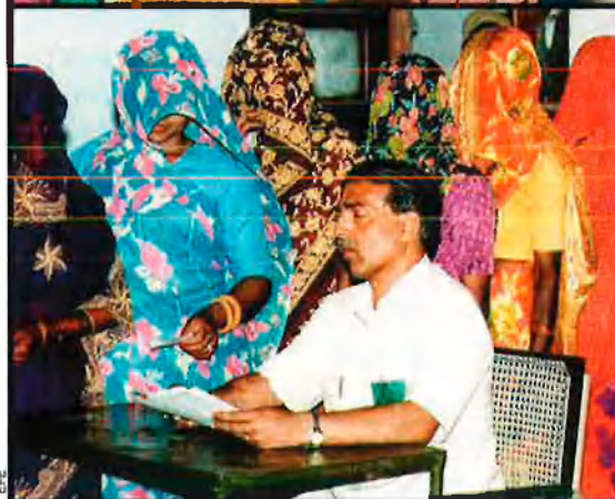
El treball de les dones: més flors i menys reconeixement. Dalt, dues nenes, a l'Índia, un 8 de març. A la dreta, ja no és el 8, sinó el 9 de març: la vida continua igual que ahir, en un camp de desplaçats per les inundacions de l'any 2000, a Moçambic. A l'esquerra, una cua per a votar, al Rajastan, a l'Índia.