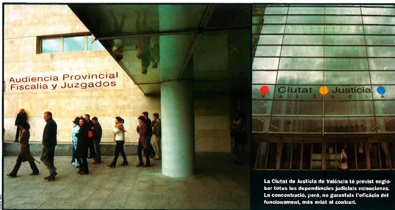
La Ciutat de Justícia de València té previst englobar totes les dependències judicials valencianes. La concentració, però, no garanteix l'eficàcia del funcionament, més aviat al contrari.

21 mil·ligrams d'heroïna. En canvi, el mateix tribunal ha anul·lat la pena de tres anys de presó a què havia condemnat l'Audiència Provincial d'Alacant un home que oferia 25 mil·ligrams de cocaïna a un menor a Benidorm.