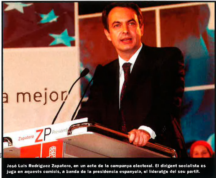
José Luis Rodríguez Zapatero, en un acte de la campanya electoral. El dirigent socialista es juga en aquests comicis, a banda de la presidència espanyola, el lideratge del seu partit.