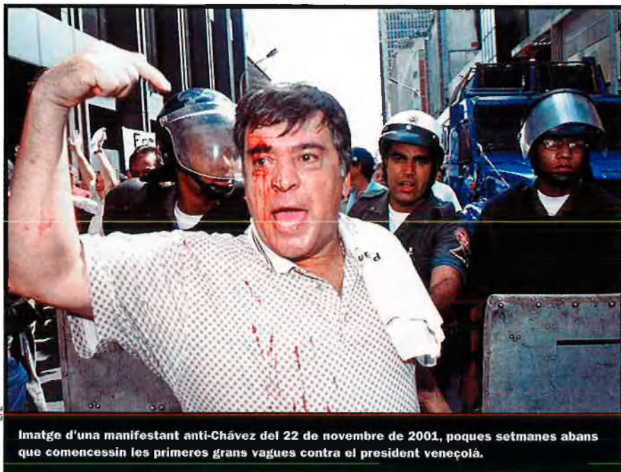
Imatge d'una manifestant anti-Chávez del 22 de novembre de 2001, poques setmanes abans que comencessin les primeres grans vagues contra el president veneçolà.