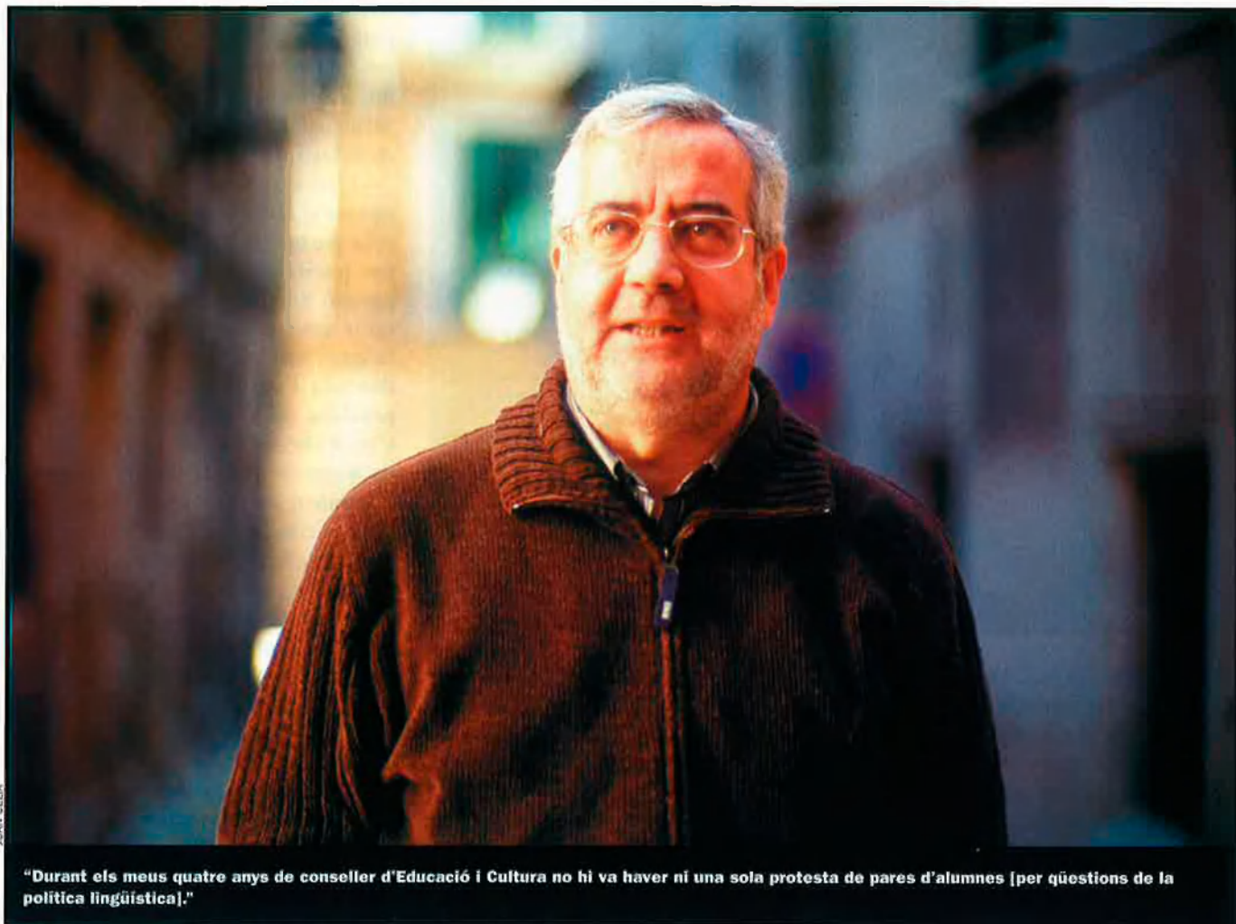
"Durant els meus quatre anys de conseller d'Educació i Cultura no hi va haver ni una sola protesta de pares d'alumnes [per qüestions de la política lingüística]."

—Quan el PP parla del binomi educació i llengua, sistemàticament fa trampa. Perquè no es pot agafar, com fa, un article de la llei de normalització lingüística, aïllar-lo dels altres i treure'n conclusions generals. L'article 18 d'aquesta llei diu que els pares tenen dret a triar la llengua en el primer ensenyament, però aquest article no existeix tot sol, sinó que s'ha de conjugar amb tots els altres i amb tota l'altra legislació educativa i lingüística. Per exemple, l'article 1.2 b) diu que un dels objectius bàsics ha de ser el d'assegurar l'ús progressiu del català com a llengua vehicular en l'àmbit de l'ensenyament; o l'article 22.3, que diu clarament que els alumnes no poden ser separats en centres diferents per raó de llengua... A més, s'ha de tenir en compte l'aplicabilitat pràctica de les mesures que es decideixen en relació amb els recursos