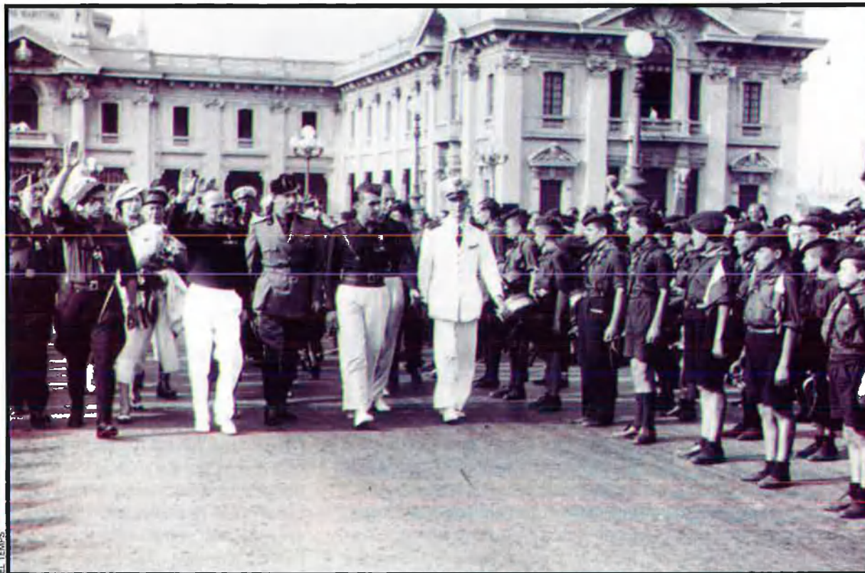
Visita d'una delegació oficial franquista a Gènova. Desfilen a l'estació marítima del port el juliol del 1937. A la capital de la Ligúria hi havia la colònia de catalans refugiats més nombrosa, la majoria dels quals eren de dreta i de missa, salvats per la Generalitat de Catalunya, que els expedí un visat de sortida.

presentant de la diplomàcia republicana, i fins que no es va adherir al Govern de Burgos –va ser dels primers cònsols a fer-ho– no podia portar a terme una acció plenament satisfactòria per als interessos coincidents dels refugiats i del Govern de Benito Mussolini, simpatitzant amb la revolta militar feixista espanyola.