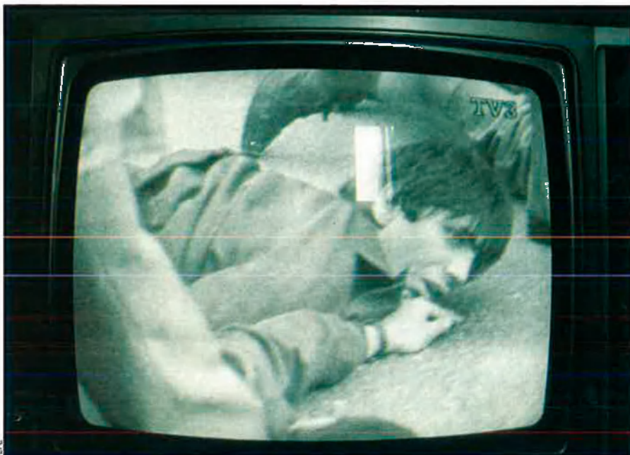
El Vaquilla, en un moment en què va ser detingut. Aquest atracador es va convertir durant la transició democràtica en una icona per als joves marginals que volien transgredir les normes i triomfar. Ara és un referent llunyà per a molts membres actuals de bandes urbanes, que, tot i que no el coneixen com a personatge, han sentit a parlar d'ell i de les seues gestes contra la policia.