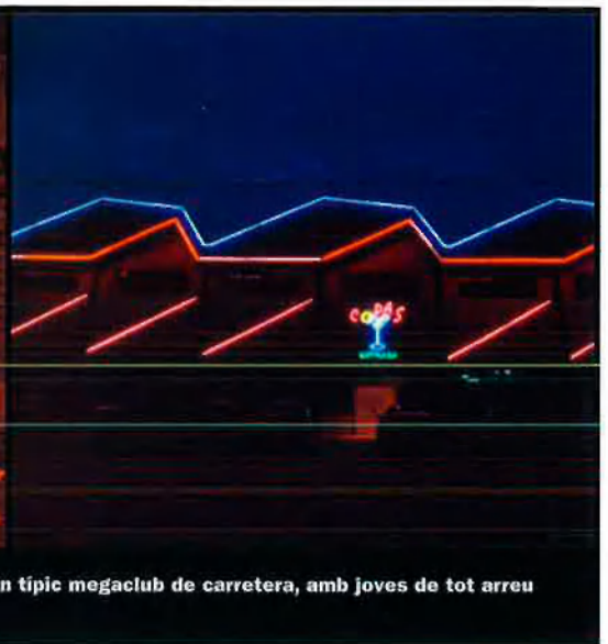
A l'esquerra, una escena de trobada amb meretrius de l'Est. Al costat, la façana d'un típic megaclub de carretera, amb joves de tot arreu que es prostitueixen.