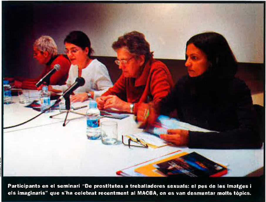
Participants en el seminari "De prostitutes a treballadores sexuals: el pes de les imatges i els imaginaris" que s'ha celebrat recentment al MACBA, on es van desmuntar molts tòpics.