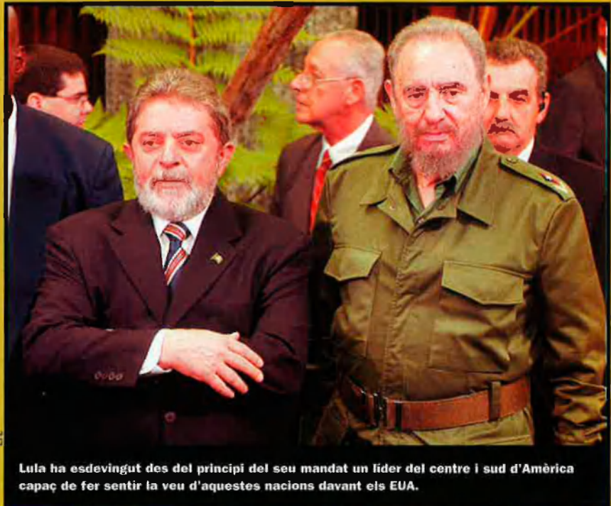
Lula ha esdevingut des del principi del seu mandat un líder del centre i sud d'Amèrica capaç de fer sentir la veu d'aquestes nacions davant els EUA.

La determinació en la lluita contra la fam, que no és un mal exclusiu del Brasil sinó que es troba estesa a bona part del sud, una política exterior que no està condicionada pels interessos dels Estats Units (visita a Cuba) i el lideratge a la cimera de Cancun, en defensa dels països del sud, li han fet guanyar protagonisme a una Amèrica Llatina desorientada. Després del fracàs de les experiències socialistes, tant del socialisme real