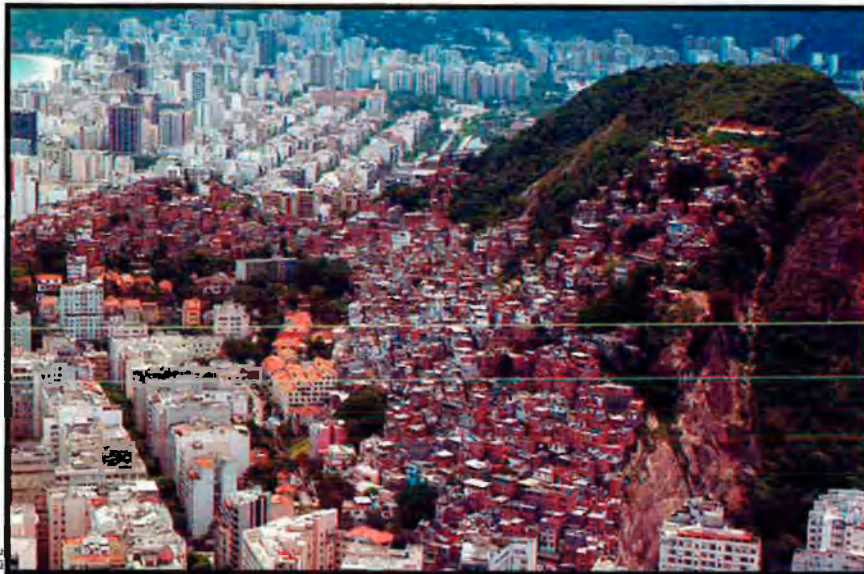
Ciutats com Rio han vist com creïxen les faveles als seus suburbis. En aquest sentit una de les primeres propostes de Lula ha estat concedir-los títols de propietat als qui hi viuen.