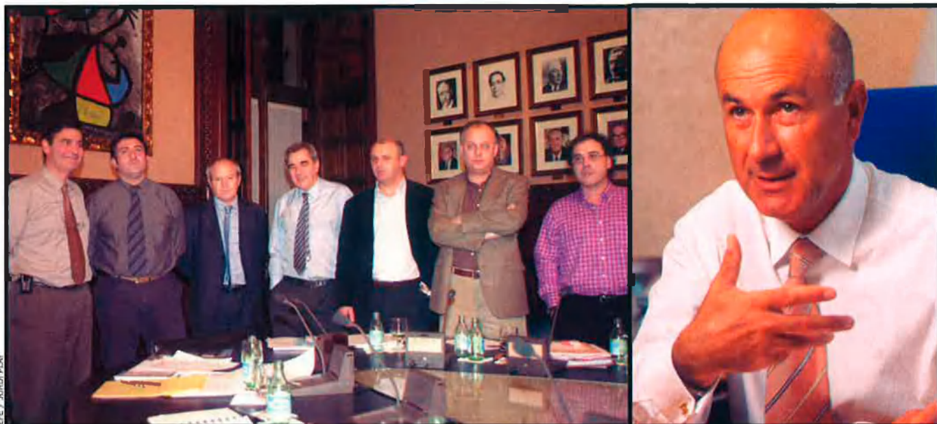
A l'esquerra, un moment de les negociacions entre PSC, ERC i ICV-EUIA per formar el Govern. Montilla (PSC), Puigcercós (ERC) i Herrera (ICV), protagonistes d'aquelles reunions, seran ara caps de llista electoral. A la dreta, Duran Lleida, que serà el candidat de CiU per al Congrés dels Diputats.

els ha comportat un desgast entre el seu electorat o, per contra, la formació continua la seva tendència a l'alça viscuda en els darrers cicles electorals.