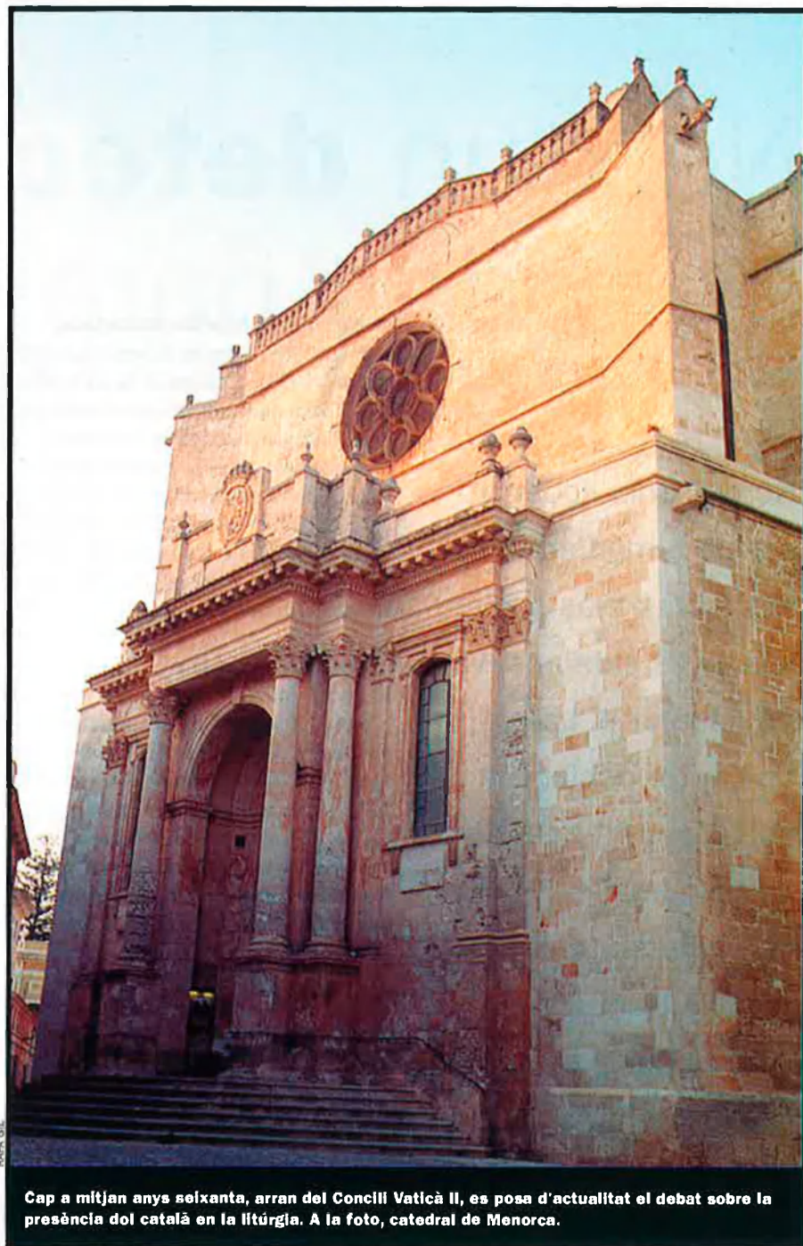
Cap a mitjan anys seixanta, arran del Concili Vaticà II, es posa d'actualitat el debat sobre la presència del català en la litúrgia. A la foto, catedral de Menorca.

La correspondència entorn d'aquesta temàtica culmina amb un escrit de Francesc de B. Moll, en el qual, posant no-