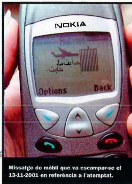
Missatge de mòbil que va escampar-se el 13-11-2001 en referència a l'atemptat.