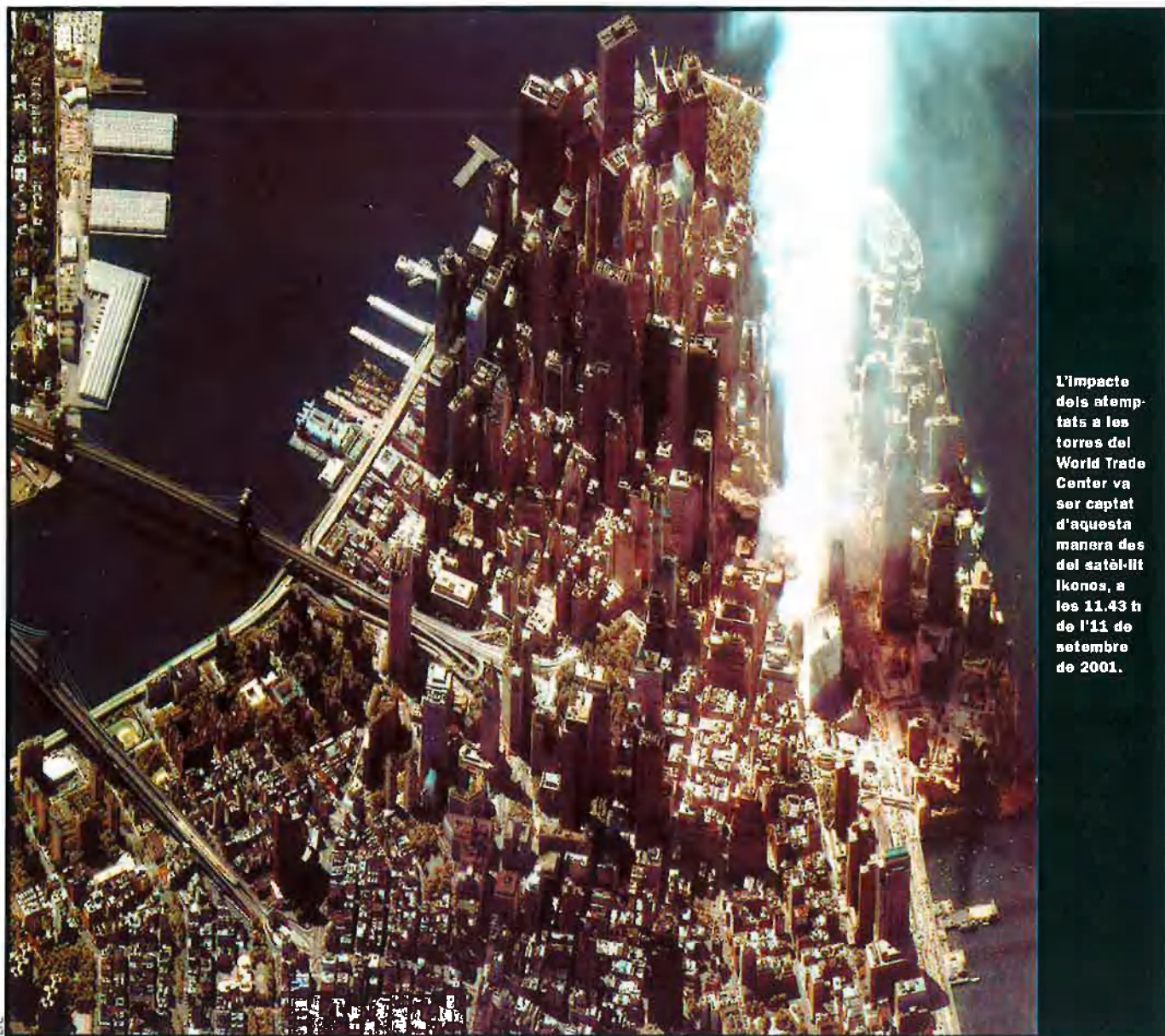
L'impacte dels atemptats a les torres del World Trade Center va ser captat d'aquesta manera des del satèl·lit Ikonos, a les 11.43 h de l'11 de setembre de 2001.

tel·ligència han rebut còpies d'aquelles parts de les declaracions que afecten Alemanya. No obstant això, els nord-americans han prohibit als alemanys fer servir el material en processos judicials contra sospitosos de terrorisme, la qual cosa posa la justícia alemanya en una situació ben delicada.