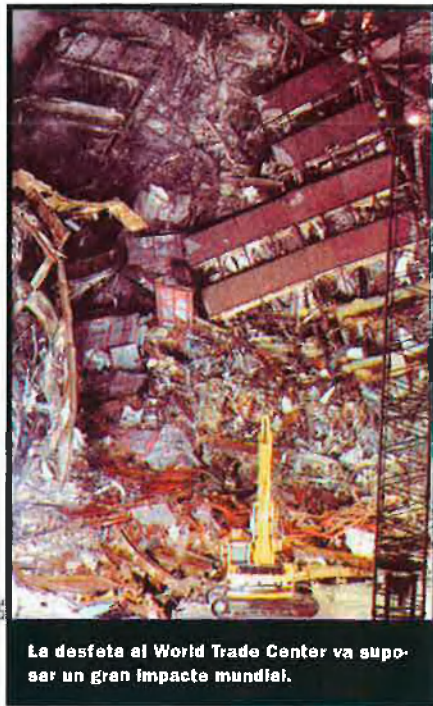
La desfeta al World Trade Center va suposar un gran impacte mundial.

Xeikh Mohàmmed ha declarat a l'administració nord-americana que ell havia