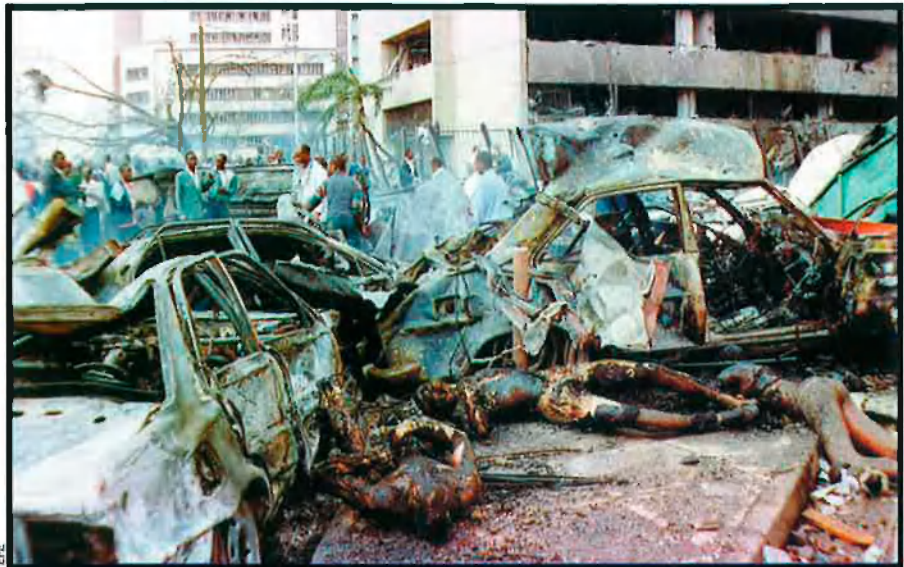
Atemptat a Nairobi el 7 d'agost de 2000, prop de l'ambaixada dels EUA. L'atemptat, que va ser atribuït a la xarxa Al-Qaida, va fer 60 morts i més de mil ferits.

Per què no accontentar-se d'entrada amb quatre pilots?, va proposar el príncep del terror amb un gran pragmatisme en una d'aquestes reunions amb Xeikh Mohàmmmed. Ell comptava ja amb quatre joves que en aquell moment estaven disposats a morir per Al·là. Tan sols calia entrenar-los adequadament. Dos dels candidats,