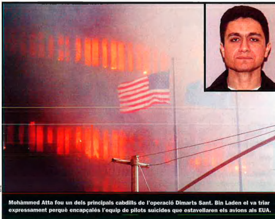
Mohàmmet Atta fou un dels principals cabdills de l'operació Dimarts Sant. Bin Laden el va triar expressament perquè encapçalés l'equip de pilots suicides que estavellaren els avions als EUA.

que el país quedara aviat enfonsat. Aleshores, segons ell, podrien "matar-ne tots els habitants".