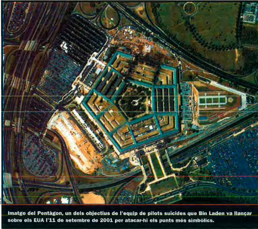
Imatge del Pentàgon, un dels objectius de l'equip de pilots suïcides que Bin Laden va llançar sobre els EUA l'11 de setembre de 2001 per atacar-hi els punts més simbòlics.

nant-li que s'abstinguera d'intentar-ho de nou, estava clar que, potser la resta del grup es convertirien en màrtirs, però no Binalshibh.