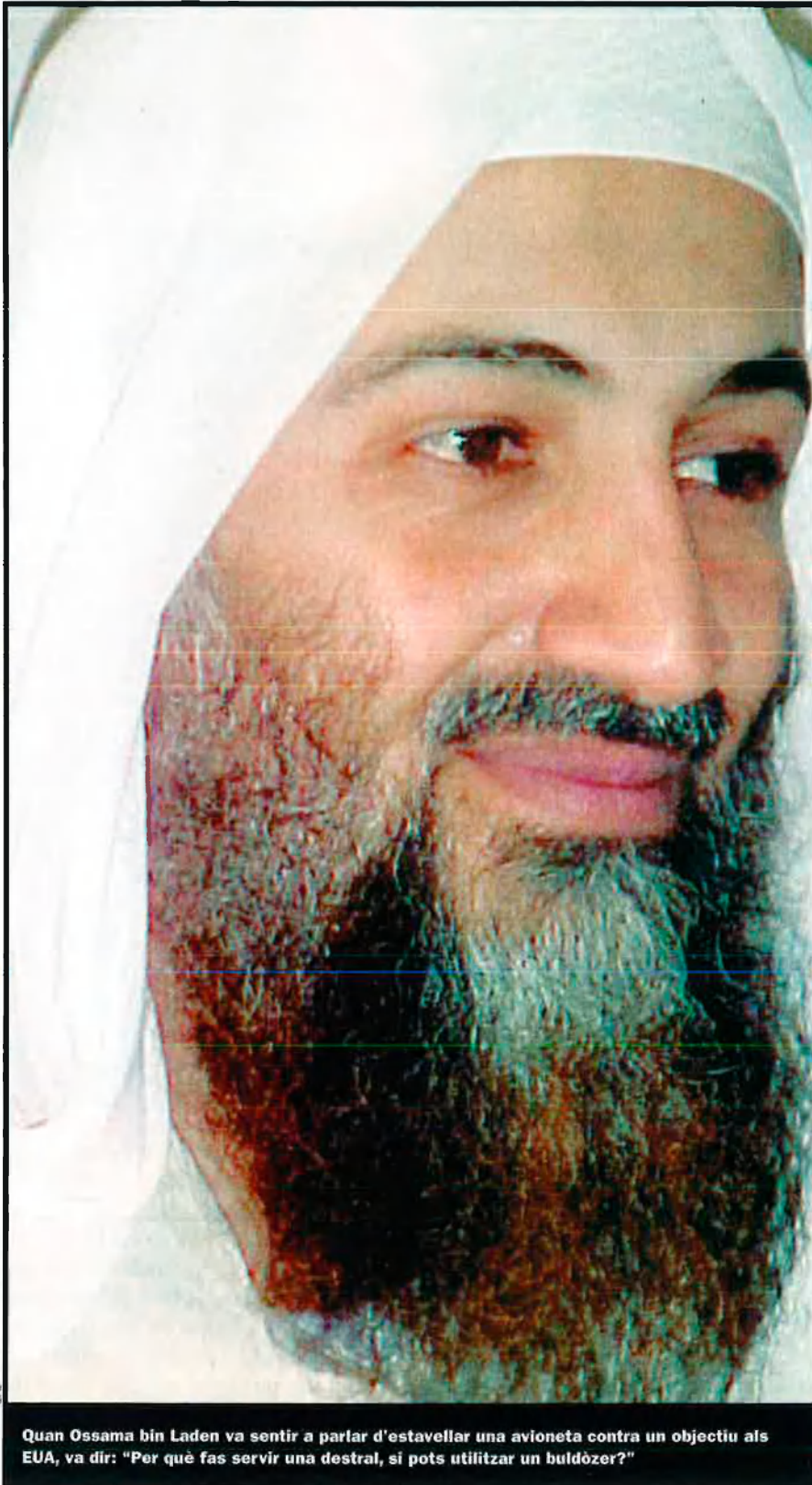
Quan Ossama bin Laden va sentir a parlar d'estavellar una avioneta contra un objectiu als EUA, va dir: "Per què fas servir una destrat, si pots utilitzar un bulldozer?"