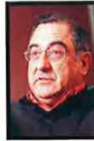
POLÍTICA TERRITORIAL JOAQUIM NADAL