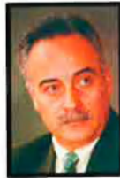
GOVERNACIÓ JOAN CARRETERO