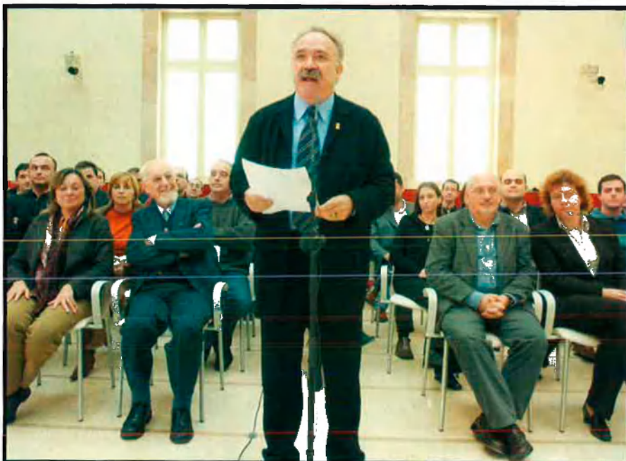
El líder d'ERC, Josep-Lluís Carod-Rovira, al Parlament de Catalunya, acompanyat de l'executiva del partit i del grup parlamentari, anuncia formalment el suport a un Govern amb PSC i ICV-EUiA.