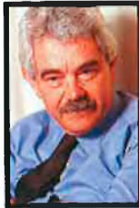
PRESIDENT PASQUAL MARAGALL