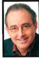
ENSENYAMENT JOSEP BARGALLÓ