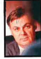
UNIVERSITATS, I INVESTIGACIÓ CARLES SOLÀ