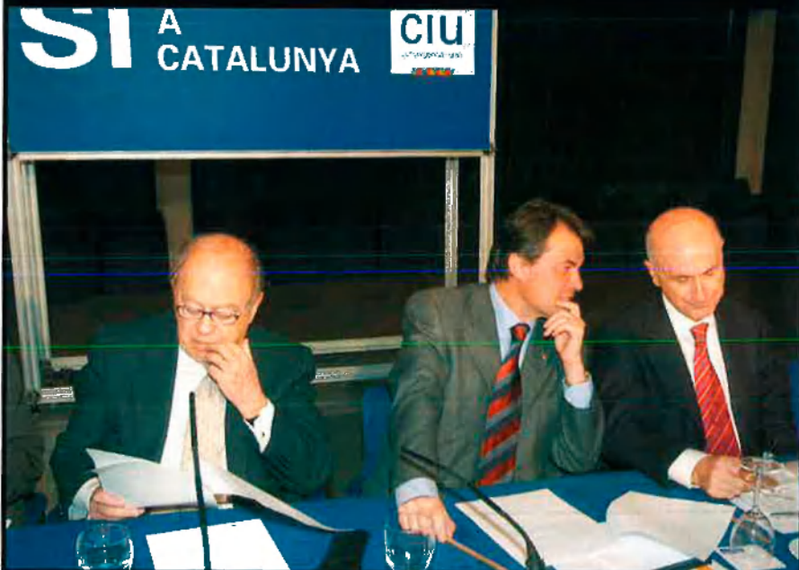
Jordi Pujol, Artur Mas i Josep Antoni Duran Lleida, en la reunió executiva de CiU que va analitzar les conseqüències per a la formació de l'acord entre les forces d'esquerra.

“vinculació subalterna de CiU al PP en els darrers vuit anys”.