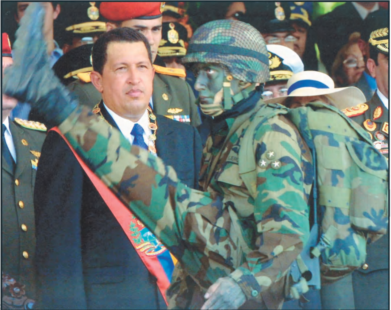
Segons l'oposició, la incapacitat d'Hugo Chávez per plantar cara al principal problema de Veneçuela, l'exclusió social, l'ha dut a aquesta complicada situació. La manca de diàleg amb els seus rivals és una altre dels retrets que li fan.

quemes clientelistes i corruptes de l'administració és el que va rebel·lar les formacions polítiques tradicionals, el sindicat de sempre (la CTV) i els grans empresaris. No s'ha d'oblidar que aquella primera vaga general del 10 de desembre del 2001 va començar el mateix dia que l'executiva promulgava la llei de terres, que pretén un repartiment més equitatiu del sòl productiu, i una nova llei d'hidrocarburs, que blindava qualsevol intent de privatització de Petrolis de Veneçuela (PDVSA), la principal indústria veneçolana i l'empresa més cobejada de Llatinoamèrica. A partir d'aquí, l'oposició aplegada en la Coordinadora Democràtica (CD) va decidir apostar fort per fer caure el president