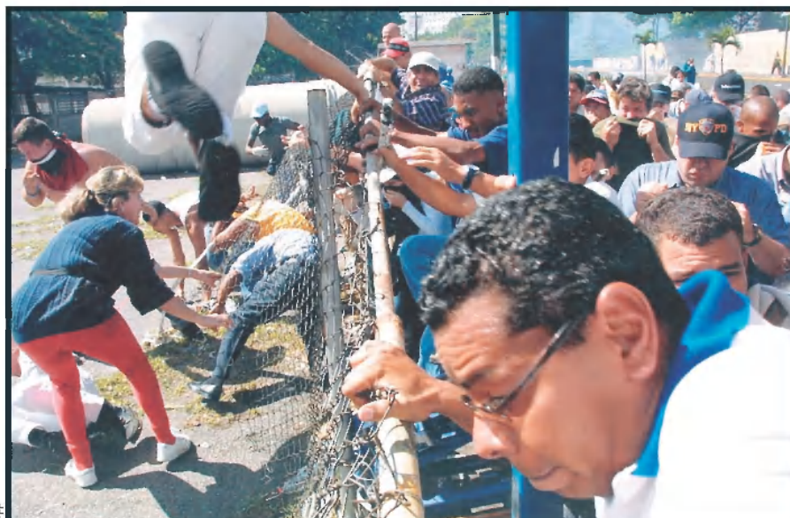
Protestes contra el president veneçolà a Caracas, l'abril del 2002. Chávez va abandonar el poder durant 47 hores. Any i mig després, la inestabilitat encara és notable.

Això es tradueix en la falta de parcialitat de les quatre televisions privades del país, que, per exemple, durant el putsch ,