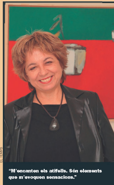
"M'encanten els atifells. Són elements que m'evocuen sensacions."

—Enguany la línia de la mar em va donar un impuls molt bo. Aquesta mateixa línia és cel i terra, si vols, una taula, fa igual. El que importa és si el quadre et diu alguna cosa. Al segle XXI ja tenim clar que un pintor no recrea els objectes tal com són: els pren d'excusa per a expressar un món interior.