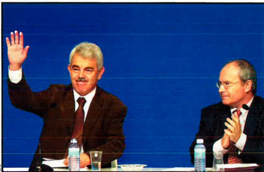
Pasqual Maragall i José Montilla, a punt d'analitzar els resultats el dia 17, a la seu del PSC. Malgrat el desencís inicial, els socialistes catalans no descarten governar.

Zapatero va aconseguir que el seu partit escenifiqués un suport absolut als companys catalans per negociar lliurement amb qui convingui