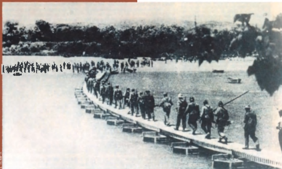
Soldats republicans travessen l'Ebre en una de les passarel·les que van fer els enginyers de l'exèrcit destacats en aquesta zona durant la Guerra Civil.

ciament clàssic, a l'estil dels que s'havien produït al segle XIX, s'havia convertit en un "tipus d'enfrontament nou". Un enfrontament que dividia Espanya en dues meitats, seguint, en algunes ocasions, la lògica de la història i de la societat, i en altres el pur atzar. Però ben aviat quedaven clars els avantatges i desavantatges de cada camp: l'existència d'un exèrcit professional al Marroc, amb experiència de guerra, al costat dels revoltats, i la ràpida ajuda internacional al seu favor situaven en un clar avantatge els militars insurrectes.