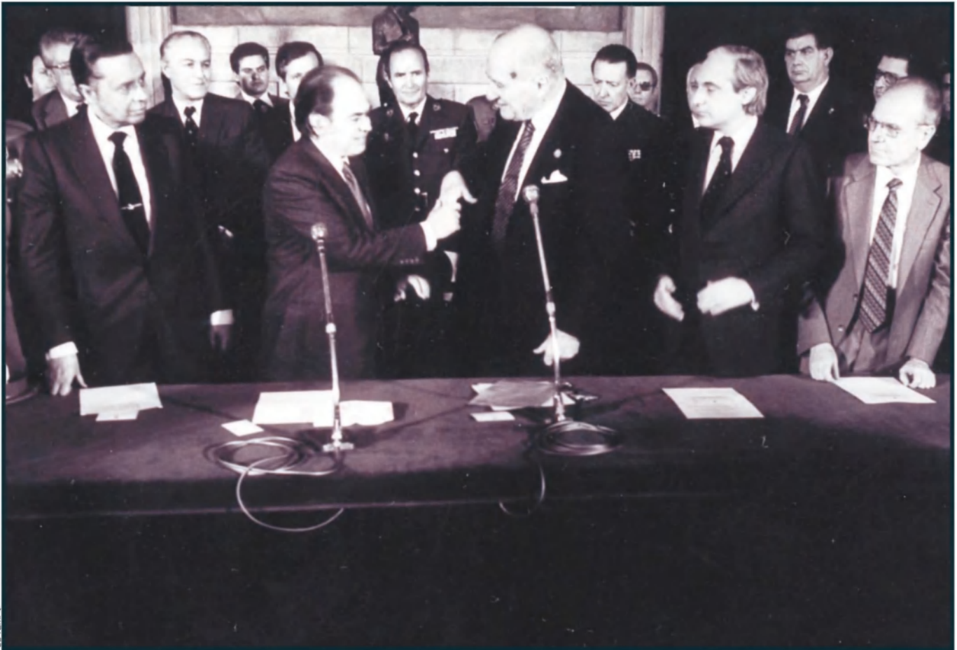
El candidat a la presidència de la Generalitat per la coalició Convergència i Unió, Jordi Pujol, va ser proclamat president català en les primeres eleccions després de la mort de Franco. Va aconseguir capgirar tots els pronòstics que donaven per feta la victòria de les forces d'esquerra.

autonòmiques, l'aixecament d'una administració o l'elaboració de les lleis bàsiques per desenvolupar el nou estatut, requerien un executiu estable i amb un suport ampli. Per aquest motiu, CiU va proposar al PSC, llavors sota el lideratge de Joan Reventós, la possibilitat d'establir un pacte de govern. Amb aquella proposta, es garantia un govern de 66 diputats, molt proper a la majoria absoluta. L'oferta va ser rebutjada pels socialistes catalans. Davant la negativa, CiU va oferir un acord de govern a ERC, liderada per Heribert Barrera. Els republicans consideraven que aquella fórmula, que sumava només 57 diputats, no garantia un govern suficientment estable. Finalment CiU va aconseguir un acord d'investidura, a la segona volta de les votacions d'investidura, amb CC-UCD –com a contrapartida del suport de CiU al Govern d'Adolfo Suárez– i amb ERC. Aquell pacte va evitar