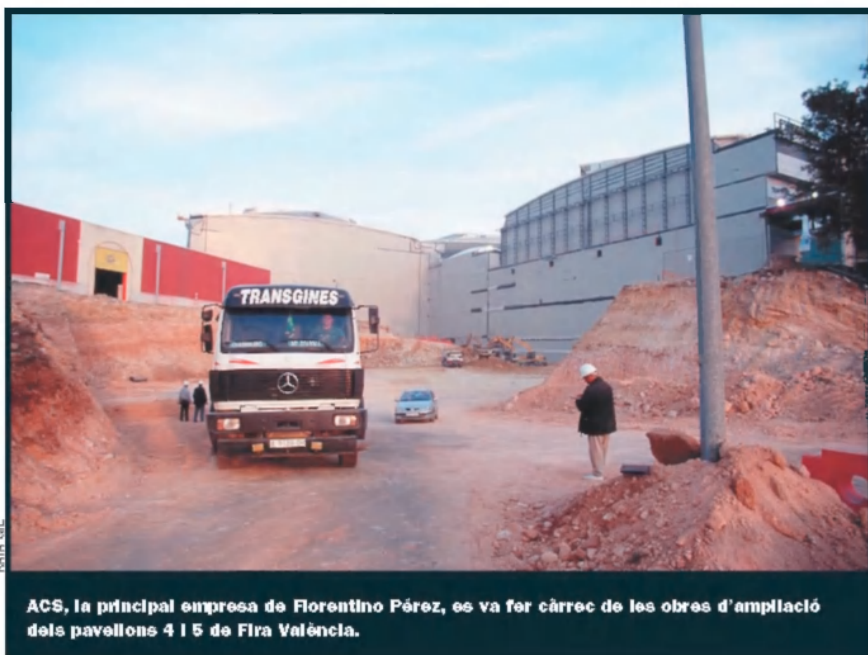
ACS, la principal empresa de Florentino Pérez, es va fer càrrec de les obres d'ampliació dels pavellons 4 i 5 de Fira València.

les variants de Gandia, Villena, Mon-taverner i Sollana, han estat també altres de les operacions d'ACS al País Valencià. Fins i tot l'Ajuntament de Gandia, en mans socialistes, li va confiar les obres d'eliminació d'inundacions a la platja.