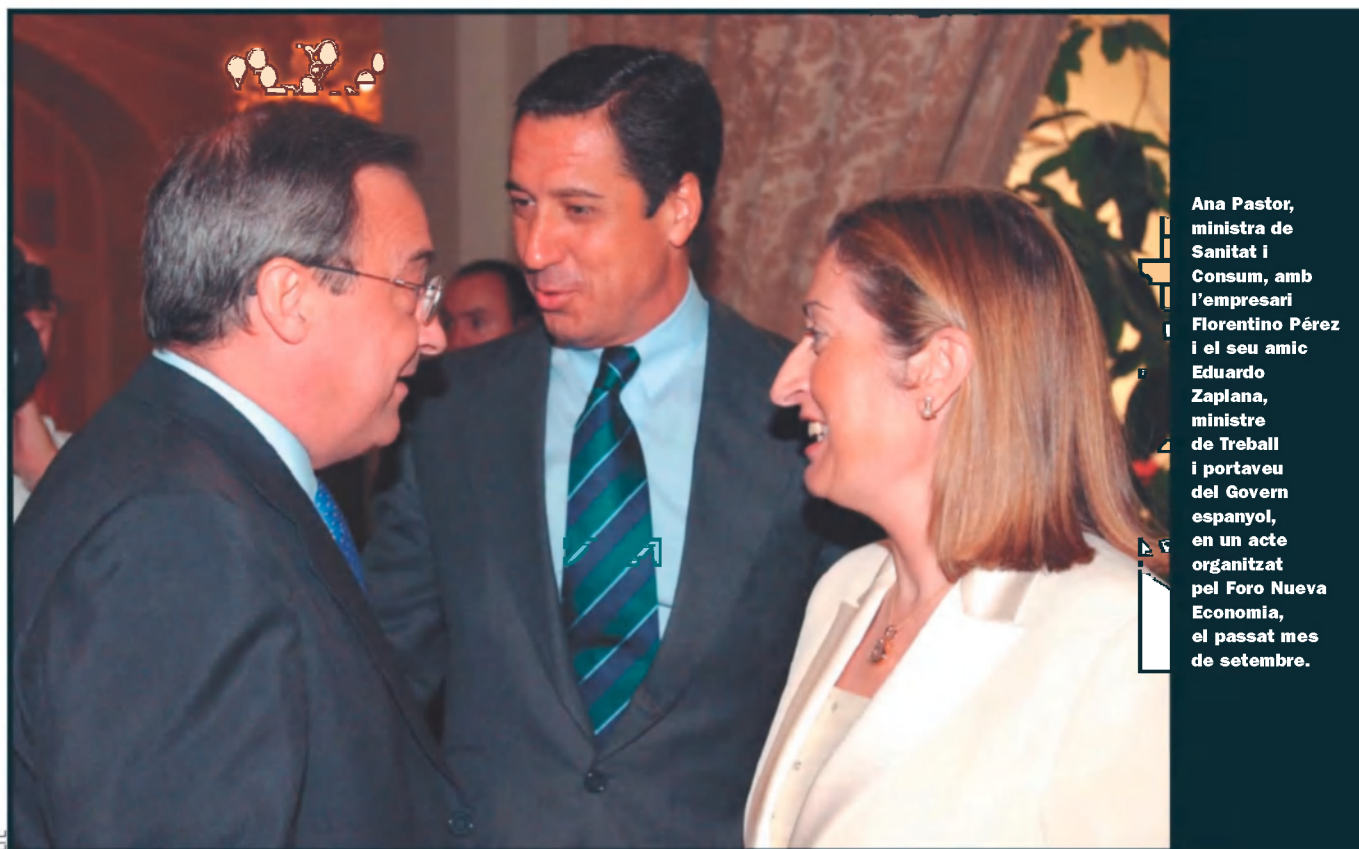
Ana Pastor, ministra de Sanitat i Consum, amb l'empresari Florentino Pérez i el seu amic Eduardo Zaplana, ministre de Treball i portaveu del Govern espanyol, en un acte organitzat pel Foro Nueva Economía, el passat mes de setembre.

lenciana durant dues legislatures. Curiosament, els anys que més s'ha endeutat la Generalitat i que més ha crescut el volum de negoci de la constructora. Aquell pessic, en resum, ens va confirmar que els amics sempre estan per ajudar-se.