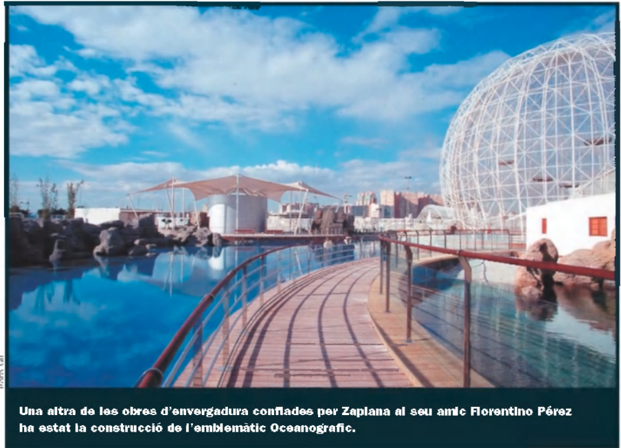
Una altra de les obres d'envergadura confiades per Zaplana al seu amic Florentino Pérez ha estat la construcció de l'emblemàtic Oceanogràfic.

Després de la crisi empresarial i passades les darreres eleccions autonòmiques, el conegut empresari Fernando Fernández Tapias ha estat nomenat membre del consell d'administració d'AVSA en representació dels seus socis majoritaris, els francesos Bouygues. Fernández Tapias, conegut amb el malnom de Fefé, és un bon amic de Florentino Pérez —no en va és el vicepresident