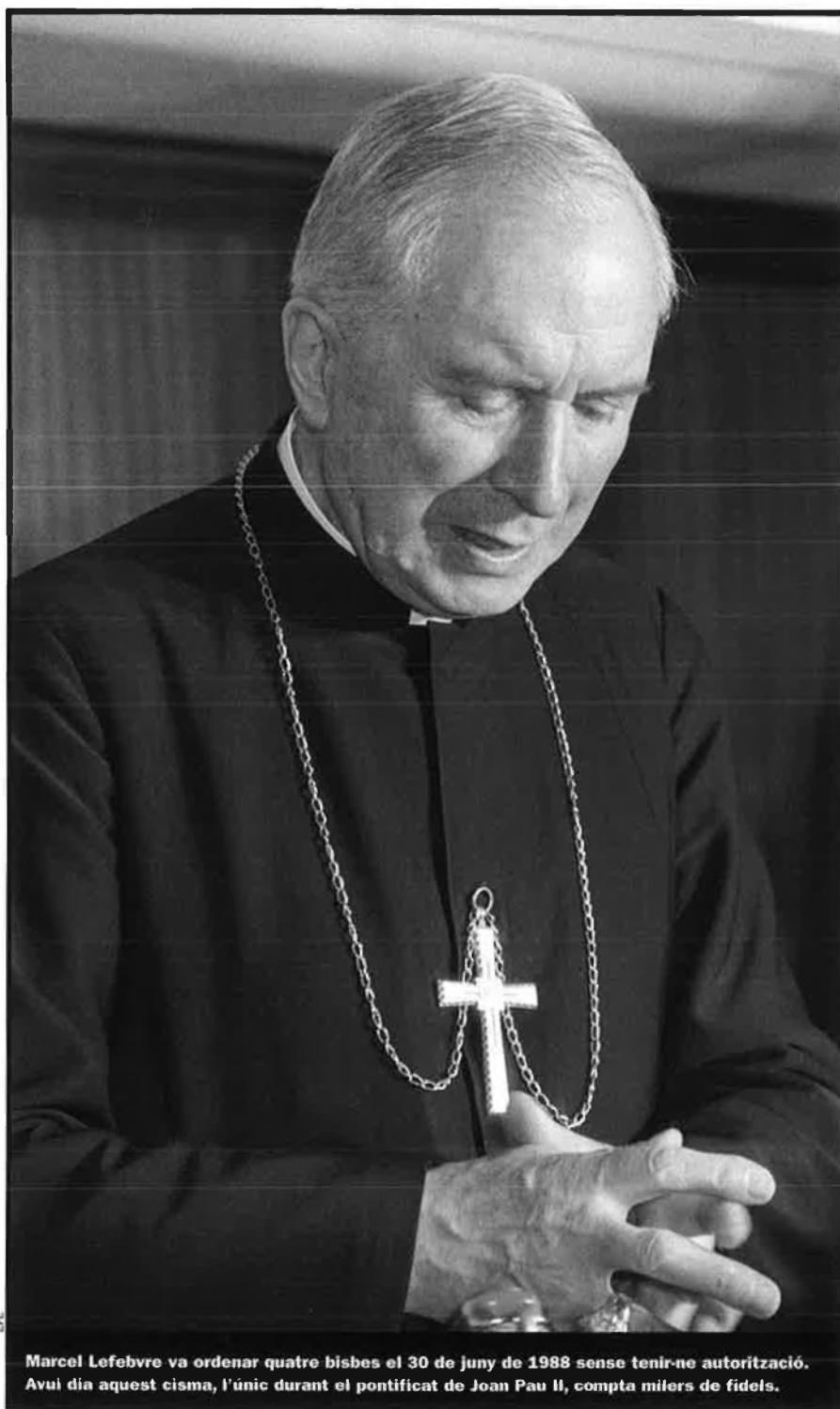
Marcel Lefebvre va ordenar quatre bisbes el 30 de juny de 1988 sense tenir-ne autorització. Avui dia aquest cisma, l'únic durant el pontificat de Joan Pau II, compta milers de fidels.

Universitat Gregoriana de Roma, va marxar de missioner al Gabon. Director de diversos seminaris, quan tenia només quaranta-set anys va rebre la consagració episcopal i va ser arquebisbe de Dakar fins al 1962, any en què començava el Concili Vaticà II. Tot i els anys africans, no era partidari de