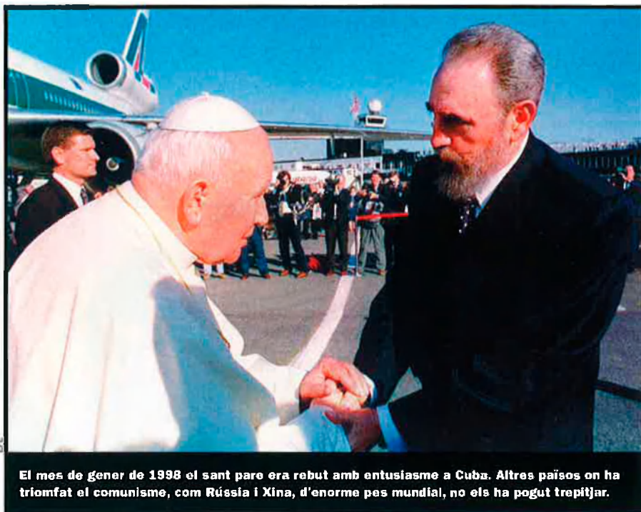
El mes de gener de 1998 el sant pare era rebut amb entusiasme a Cuba. Altres països on ha triomfat el comunisme, com Rússia i Xina, d'enorme pes mundial, no els ha pogut trepitjar.

Fàtima, Rússia i el papa. Joan Pau II està lligat de manera especial a Fàtima. Ho ha dit ell i ho ha confirmat un fet històric, com l'atemptat que va patir a la plaça de Sant Pere, que va tenir lloc precisament un 13 de maig, dia de la Mare de Déu de Fàtima. Què té a veure Fàtima amb Rússia? Molt. Tot, gairebé.