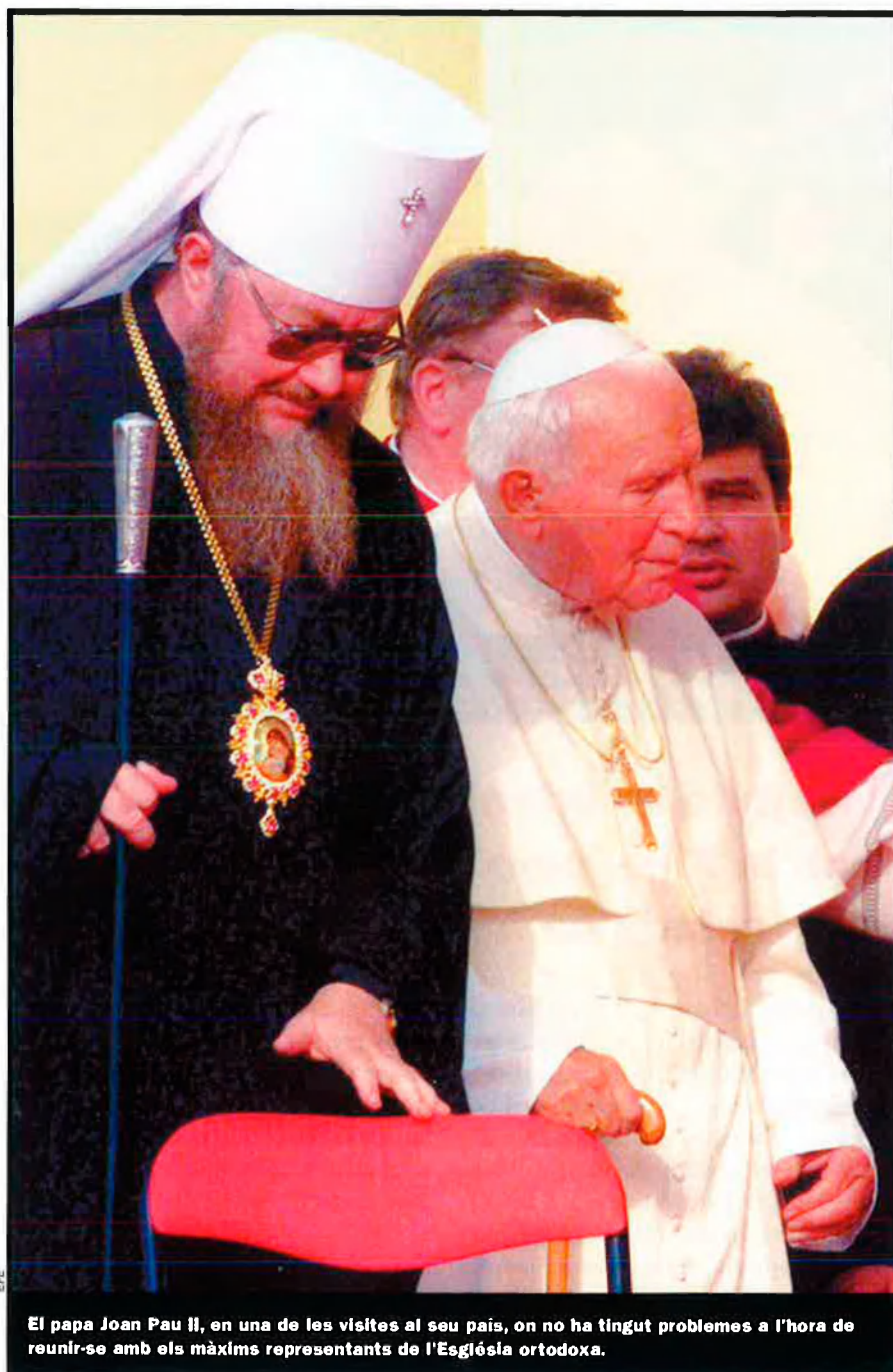
El papa Joan Pau II, en una de les visites al seu país, on no ha tingut problemes a l'hora de reunir-se amb els màxims representants de l'Església ortodoxa.

una trobada que ja mai més no ha estat propícia.