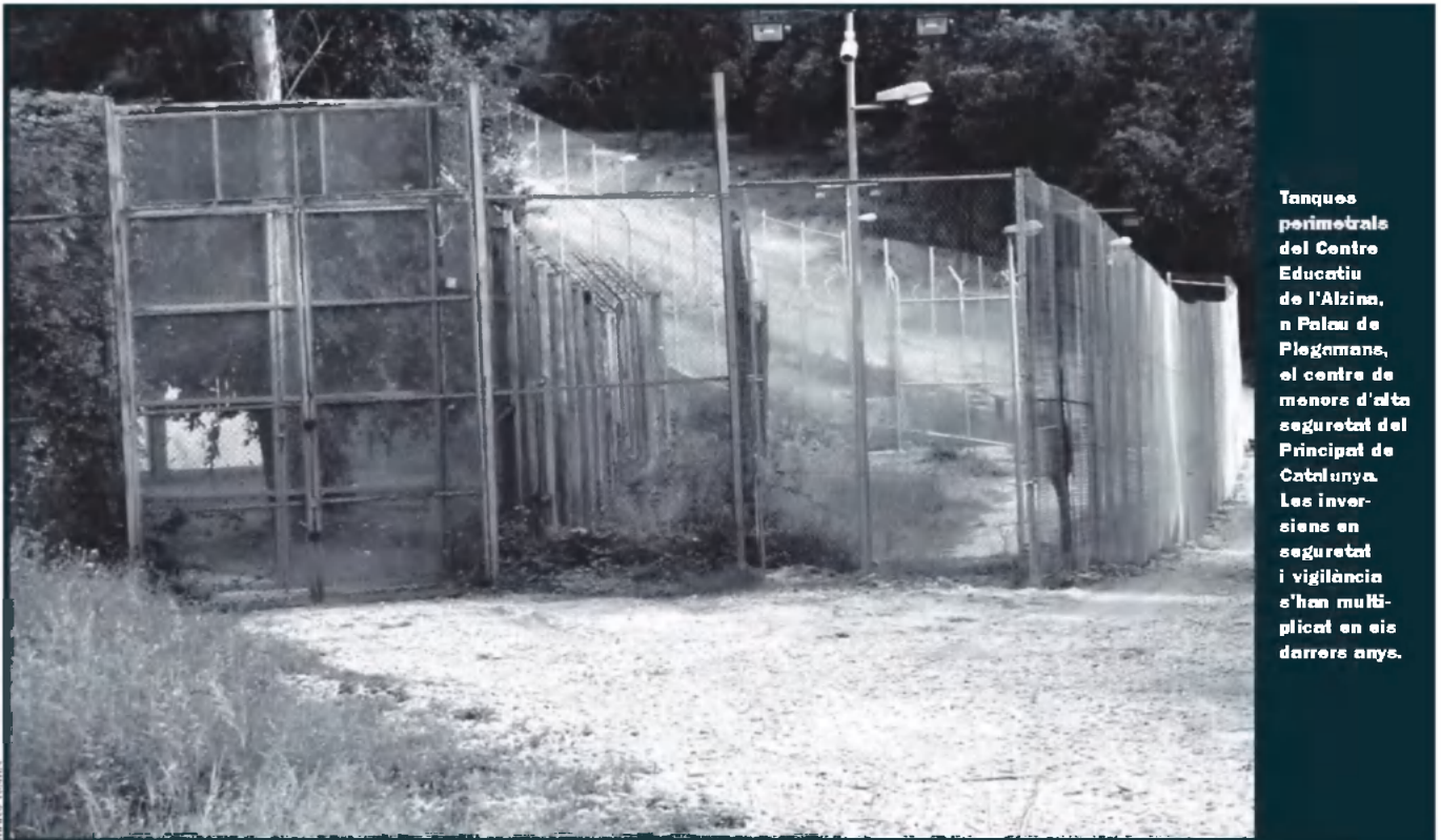
Tanques perimetrals del Centre Educatiu de l'Alzina, a Palau de Plegamans, el centre de menors d'alta seguretat del Principat de Catalunya. Les inver- sions en seguretat i vigilància s'han multi- plicat en els darrers anys.

“Era un noi molt conflictiu”, explica aquesta treballadora. “No era violent ni agressiu, però tenia un trastorn adaptatiu molt fort. Actuava de manera incontrolada: un dia omplia les parets de l’habitació d’excrements, i l’altre es despullava en públic.” No va trigar a tornar a creuar l’estret i a entrar de nou de manera il·legal a l’estat espanyol. “L’estiu del 2002, l’equip tècnic dels Til·lers va rebre una trucada d’un centre de protecció de menors del País Basc, demanant-los l’expedient del menor marroquí. Ja havia tornat.” Va fer una ruta per diversos centres d’acollida del País Basc, però no es va adaptar enlloc, “i va tornar a venir a Barcelona”, explica aquesta treballadora dels Til·lers.