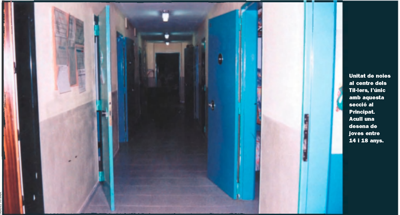
Unitat de noies al centre dels Til·lers, l'únic amb aquesta secció al Principat. Acull una desena de joves entre 14 i 18 anys.

seva habitació. El sindicat CCOO va denunciar que el rescat del noi “va resultar molt difícil i va córrer un greu perill de mort”, perquè “van fallar tots els sistemes de seguretat contra incendis: els extintors estaven caducats i no funcionaven, les mànegues no tenien aigua, la porta no era antifoc, es va dil·latar i va tancar el menor a l’interior...”