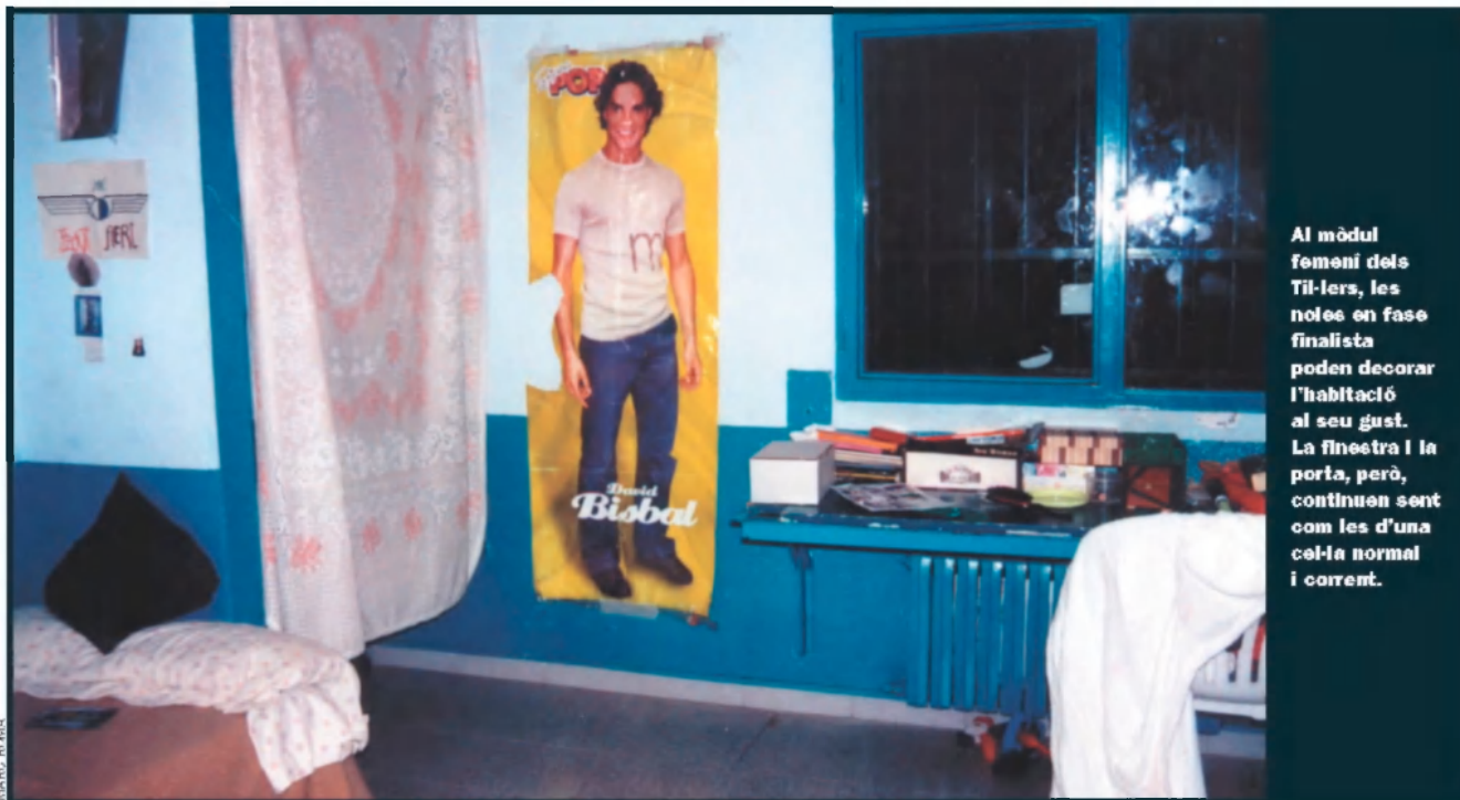
Al mòdul femeni dels Til·lers, les noies en fase finalista poden decorar l'habitació al seu gust. La finestra i la porta, però, continuen sent com les d'una cel·la normal i corrent.

de mesura passant del mòdul inicial a l'intensiu, progressant i retrocedint, fins que queda en llibertat. Així no pot aplicar-se cap mena de pla.”