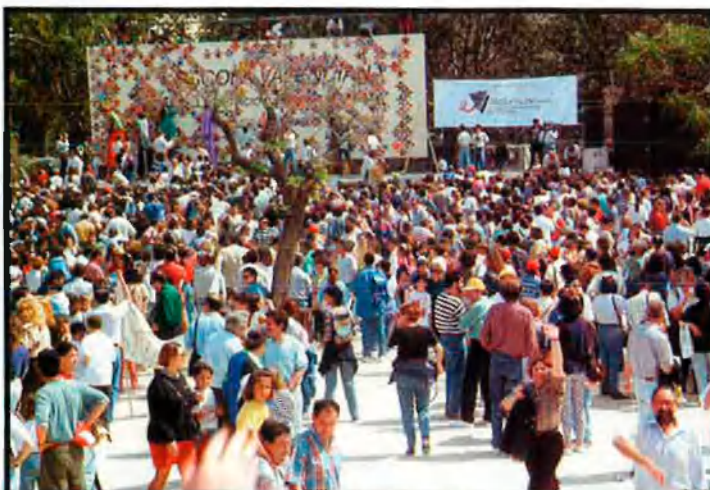
Al costat, una de les multitudinàries trobades organitzades per la Federació Escola Valenciana. A sota, al mig, el conseller d'Educació, Esteban González Pons, a Ares del Maestrat, on signà un decàleg per promoure l'ús del valencià en l'administració.