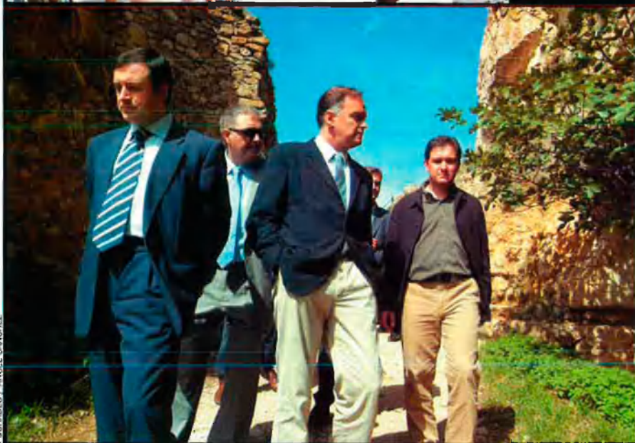
PICHUADRES / ÀNGEL SÁNCHEZ

malitzador del valencià ha estat un factor de regressió.