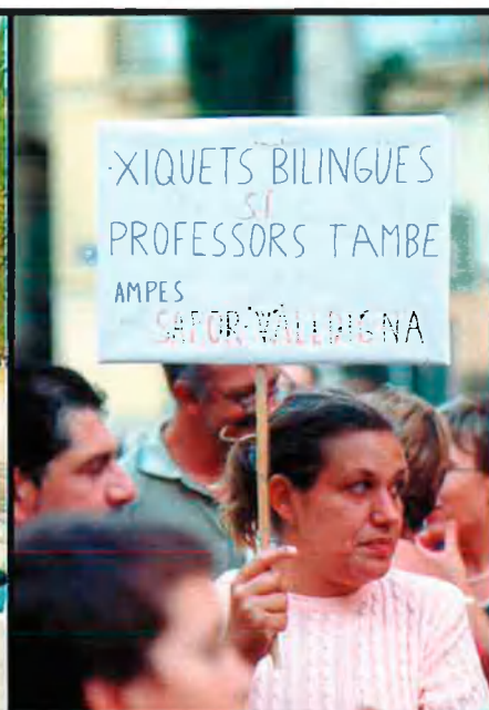
Diverses imatges de protestes contra algunes de les mesures lingüístiques preses per l'anterior Govern valencià i que continuen vigents: l'exclusió dels llicenciats de Filologia Catalana del requisit lingüístic i l'exigència de professors amb capacitat lingüística als centres amb ensenyament en valencià. A sota, a la dreta, signatura del Compromís pel Valencià, elaborat per partits, sindicats i entitats culturals i acadèmiques.