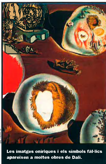
Les imatges oníriques i els símbols fàl·lics apareixen a moltes obres de Dalí.