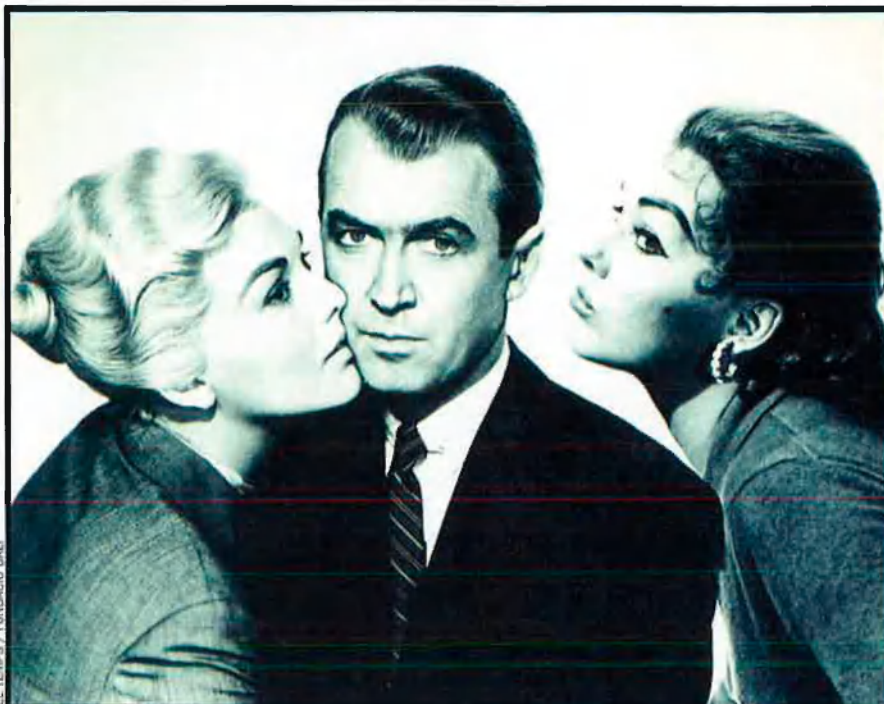
EL TEMPS / FUNDACIÓ DALÍ