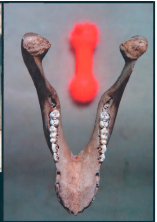
A l'esquerra, imatge del sorprenent muntatge de Carles Santos inspirat en Lisistrata , d'Aristòfanes. A la dreta, portada del book de las Comedias bárbaras , l'altre gran espectacle teatral que ha ofert la Biennal aprofitant les instal·lacions de la Nau de Sagunt. En aquesta ocasió ha estat Bigas Luna l'encarregat de posar en escena l'obra de Valle Inclán, per a la qual cosa ha gaudit d'un pressupost més que generós.