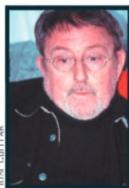
Joan Genovés Pintor