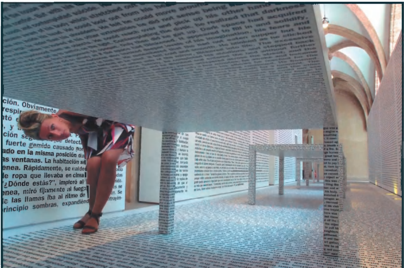
Una de les instal·lacions que, sota el títol "A&M: El magatzem de l'adequat comportament", es pot visitar a l'antic Convent del Carme de València. Aquesta exposició mostra les obres que nombrosos artistes han realitzat per a la Biennal.

les xifres, De la Calle diu: "Si l'èxit es mesura pel ressò dels mitjans de comunicació, potser haurem de reconèixer una certa incidència. Però si ens basàrem en el criteri dels especialistes, el resultat seria ben diferent." "Per això –conclou–, no és que les biennals hagen deixat de tenir sentit avui dia, sinó que s'han de preparar des d'una perspectiva determinada. Per exemple, el lema d'aquesta Biennal, el de la ciutat ideal, és sincerament interessant. Però, s'hi han reunit especialistes per parlar-ne?"