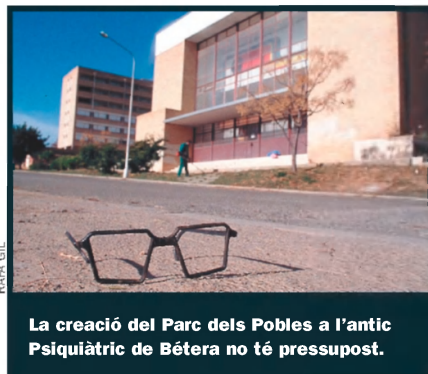
La creació del Parc dels Pobles a l'antic Psiquiàtric de Bétera no té pressupost.

ques, Mundo Ilusión, el Parc dels Pobles, la Casa del Mediterrani o l'estrambòtica Ciutat Eufòrica. La Ciutat de la Llum, presentada pel PP com la infraestructura cinematogràfica més gran d'Europa, consta d'uns grans estudis que encara ara estan en construcció al sud del terme municipal d'Alacant. Hi ha diversos interrogants. No se sap quan s'inaugurarà ni quina pot ser la seua viabilitat, sobretot si es té en compte la creixent competència en aquest tipus d'infraestructures arreu de l'estat. La Ciutat de les Arts Escèniques projectada a Sagunt està en una fase encara més embrionària. Està projec-