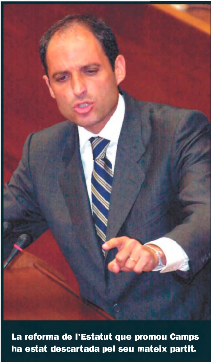
La reforma de l'Estatut que promou Camps ha estat descartada pel seu mateix partit.

està plantejada des de fa sis anys) es comprometia a arribar “fins a les últimes conseqüències constitucionals”, amb la qual cosa assumia implícitament el punt que més entrebancs pot trobar a Madrid pels dos partits majoritaris, el de la capacitat del president per dissoldre anticipadament les Corts valencianes. Diversos càrrecs del seu mateix partit, com ara Ana Mato o Mariano Rajoy, han anunciat que el PP impedirà que es modifique qualsevol Estatut d'autonomia. El mateix Eduardo Zaplana, que ha utilitzat aquesta reforma com un dels camps de batalla d'enfrontament amb Camps, ha dit en diverses ocasions que la reforma no ha d'incloure la possibilitat de dissolució de les Corts valencianes. Zaplana ha reiterat com a argument que l'executiva federal del PSOE tampoc no acceptaria aquesta proposta, la qual cosa és mentida i fins i tot ha estat desmentida públicament pel mateix José Luis Rodríguez Zapatero.