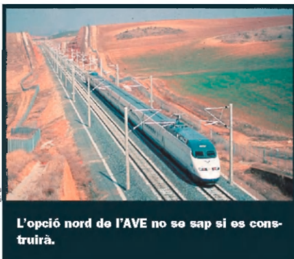
L'opció nord de l'AVE no se sap si es construirà.

Llei d'ordenació del territori. Un projecte anunciat fa ja set anys per Zaplana i que encara no ha estat dut a les Corts valencianes. Segons l'anunci de la llei d'ordenació del territori (LOT) fet pel PP, no es podrà construir en els primers 500 metres des de la franja costanera. La demora, no obstant això, ha servit perquè s'haja pogut urbanitzar bona part del litoral que encara quedava verge.