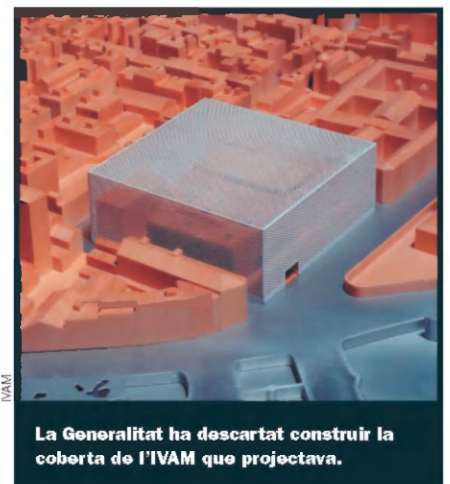
La Generalitat ha descartat construir la coberta de l'IVAM que projectava.

Embolic a l'IVAM. El passat mes d'agost, el nou conseller d'Educació i Cultura, Esteban González Pons, va anunciar que la construcció de l'espectacular coberta de ferro de l'IVAM, anunciada pel PP en la passada precampanya electoral, s'endarreriria, pel seu cost, com a mínim "fins a l'any 2007", unes declaracions que van provocar la reacció de molts representants del seu partit, lligats a Eduardo Zaplana, que van veure en aquestes paraules una acceptació implícita de la complicada situació financera de la Generalitat Valenciana. El conseller, en canvi, anuncia noves seus de