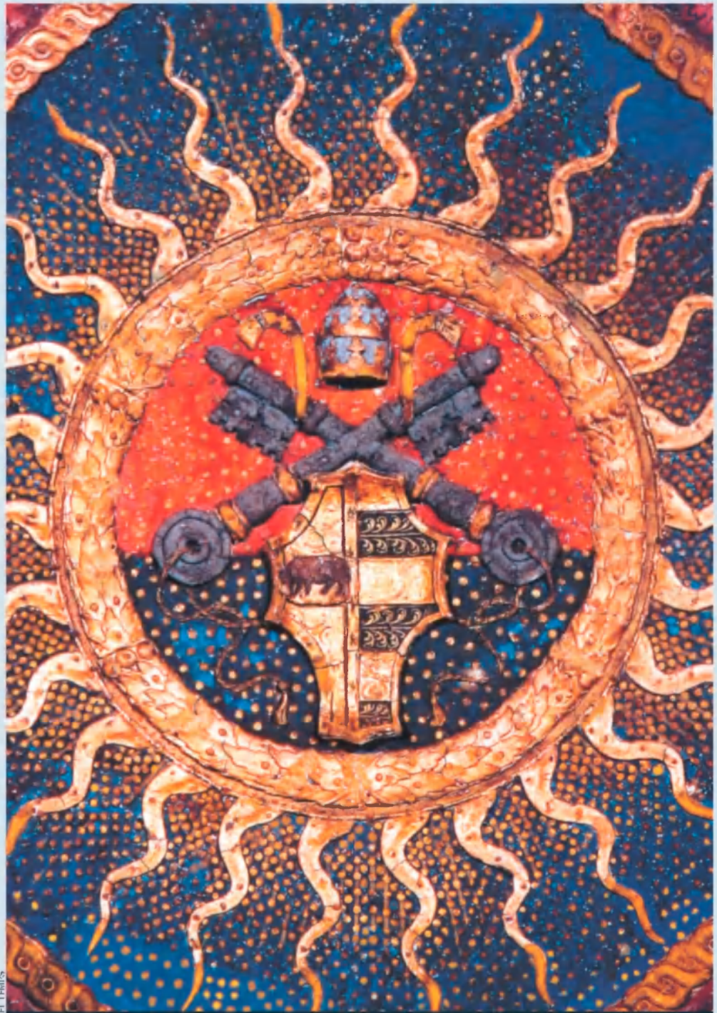
Escut d'armes del papa Alexandre VI, amb corona de llorer flamejant, pintat per il Pinturicchio. Pertany al sostre de la sala de les Arts Liberals dels apartaments Borja.