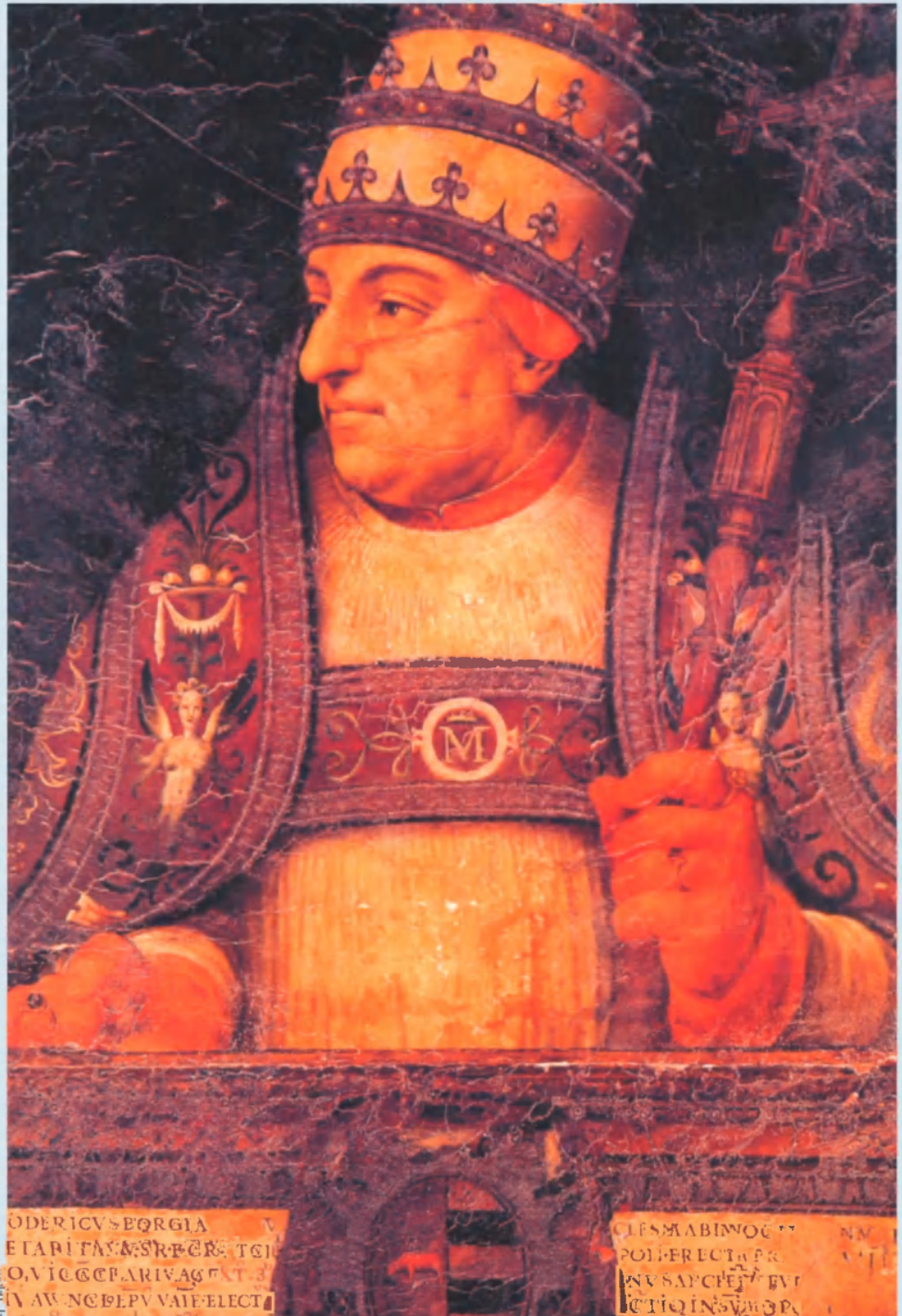
Roderic de Borja, el papa Alexandre VI, en un retrat de Joan de Joanes que es conserva a la catedral de València.

Vam posar el papa a la capella Major, cap a on vingueren els religiosos de Roma, el clergat de Sant Pere i els canonges amb la creu; i el portaren de la capella Major fins al mig de la basílica de Sant Pere, al lloc acostumat, davallant per l'escala en direcció a la porta; i, d'allí, a través del camí per on cavalquen els cardenals, a través de la porta principal del palau, fent camí recte, fins a la font; i d'allí, gairebé de través fins a les tavernes; i, des d'allí, directament per les escales de Sant Pere