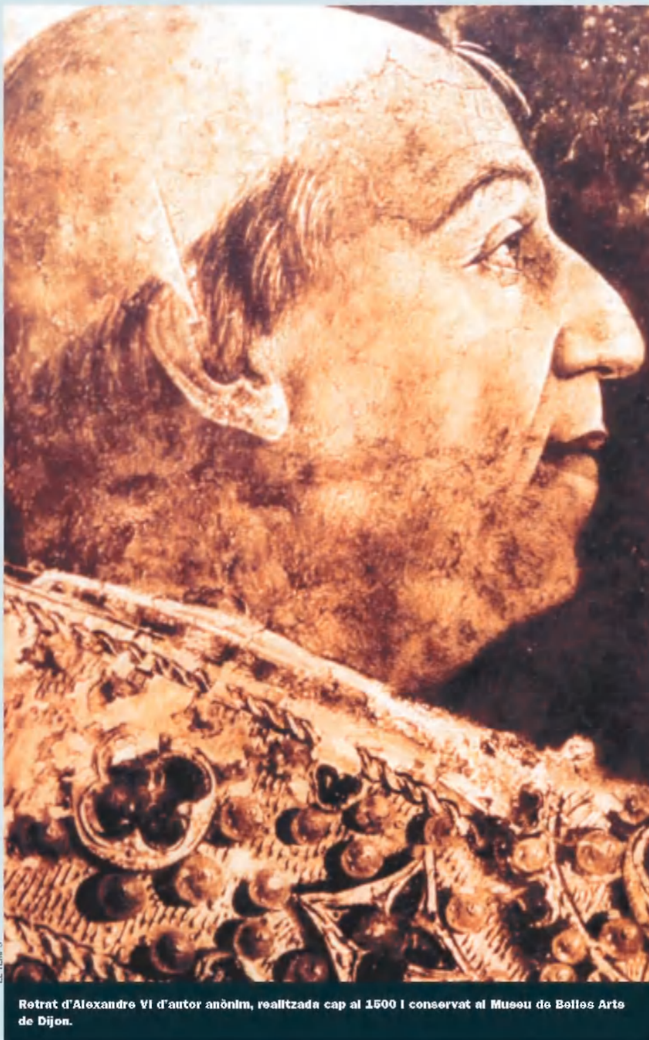
Retrat d'Alexandre VI d'autor anònim, realitzada cap al 1500 i conservat al Museu de Belles Arts de Dijon.

“I de seguida va créixer la lletjor i la negror de la seva cara, de tal manera que [...] era com un drap...”