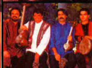
Dalt, el dia 11, el cantant i instrumentista del Kurdistan Sivan Perwer actuarà acompanyat per un grup de quatre músics. A sota, els quatre components de Masters of Persian Music, conjunt iranià que tocarà abans, aquest 3 d'octubre. A l'esquerra, el cartell que anuncia el Festival d'enguany.

amb una interessant panoràmica de la música africana actual, a través de tres visions diferents: Tunísia, Mali i Angola.