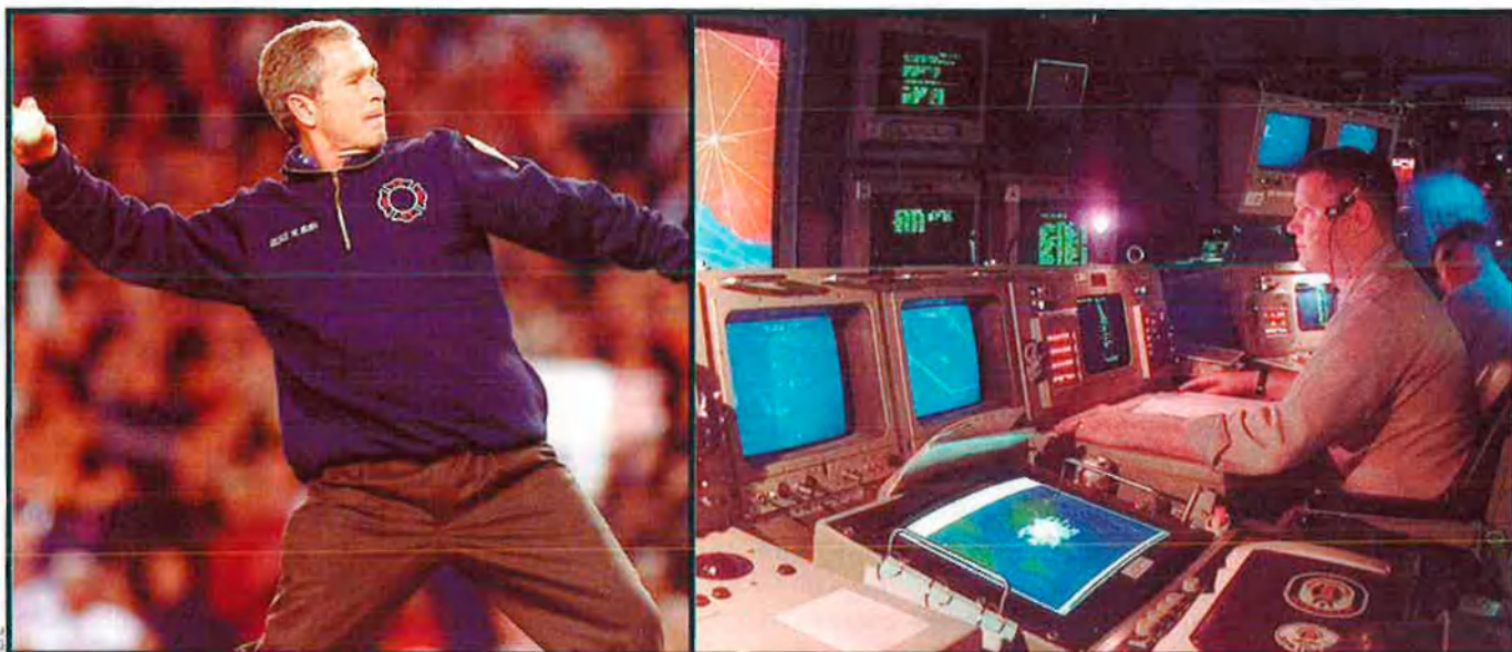
George W. Bush ha llançat el seu país cap a un món unipolar, però, tot i la seva força en molts àmbits, comença a veure que no pot assolir tots els objectius sense l'ajut de la resta del món. Nombrosos analistes debaten sobre què ha de fer Bush amb el seu exèrcit, però cap, excepte Emmanuel Todd, no planteja que els Estats Units són un Imperi en declivi.

sistema americà". És a dir, que tot el que fan els EUA i que li val l'adjectiu d'"imperial" no és una mostra de força, sinó més aviat de debilitat. A primer cop d'ull el futur d'aquest assaig podria molt ben ser a les prestatgeries de l'esoterisme i altres "ciències" ocultes, però el currículum de Todd l'avalua per fer-se un lloc en la discussió internacional sense por de fer el ridícul, o si més no amb el privilegi de ser llegit i desmentit. O confirmat. El 1976 Todd, amb només 25 anys, va escriure l'assaig La chute finale , en què recollia diverses dades demogràfiques, econòmiques i socials i preveia la fi de l'URSS, és a dir, de l'imperi soviètic.