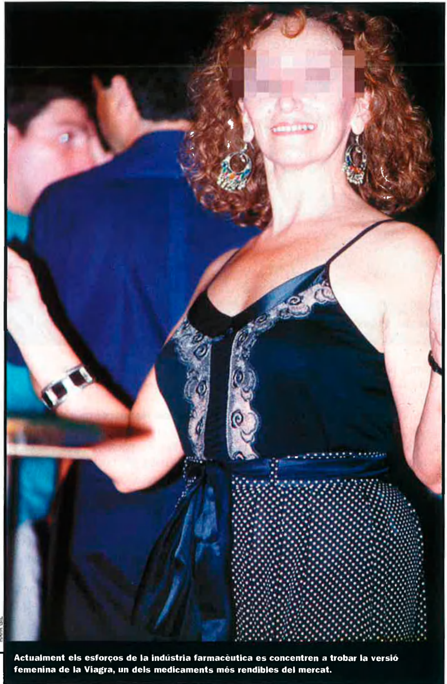
Actualment els esforços de la indústria farmacèutica es concentren a trobar la versió femenina de la Viagra, un dels medicaments més rendibles del mercat.