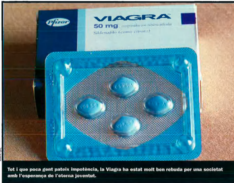
Tot i que poca gent pateix impotència, la Viagra ha estat molt ben rebuda per una societat amb l'esperança de l'eterna joventut.

ara "timidesa", que creen expectatives en la població i amplien el mercat potencial dels medicaments que s'intenten vendre.