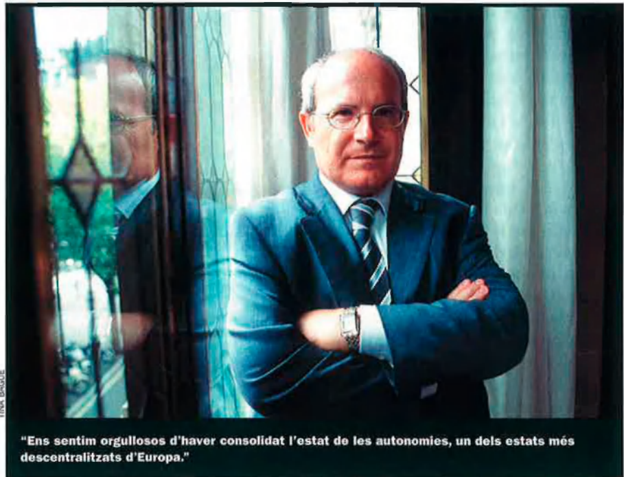
"Ens sentim orgullosos d'haver consolidat l'estat de les autonomies, un dels estats més descentralitzats d'Europa."

Precisament, com que fem una valoració positiva d'aquests 25 anys, pensem que avui hi ha condicions per fer un pas endavant, cap a la consolidació d'aquest estat de les autonomies, per adaptar-lo a les circumstàncies actuals. Avui hi ha competències de l'estat nació que són d'Europa; hi ha un grapat de comunitats autònomes que ni se sabia quines eren quan es va aprovar la Constitució; cal tractar la situació de les comunitats en el procés de la presa de decisions de l'estat en el si de la Unió Europea; cal millorar els