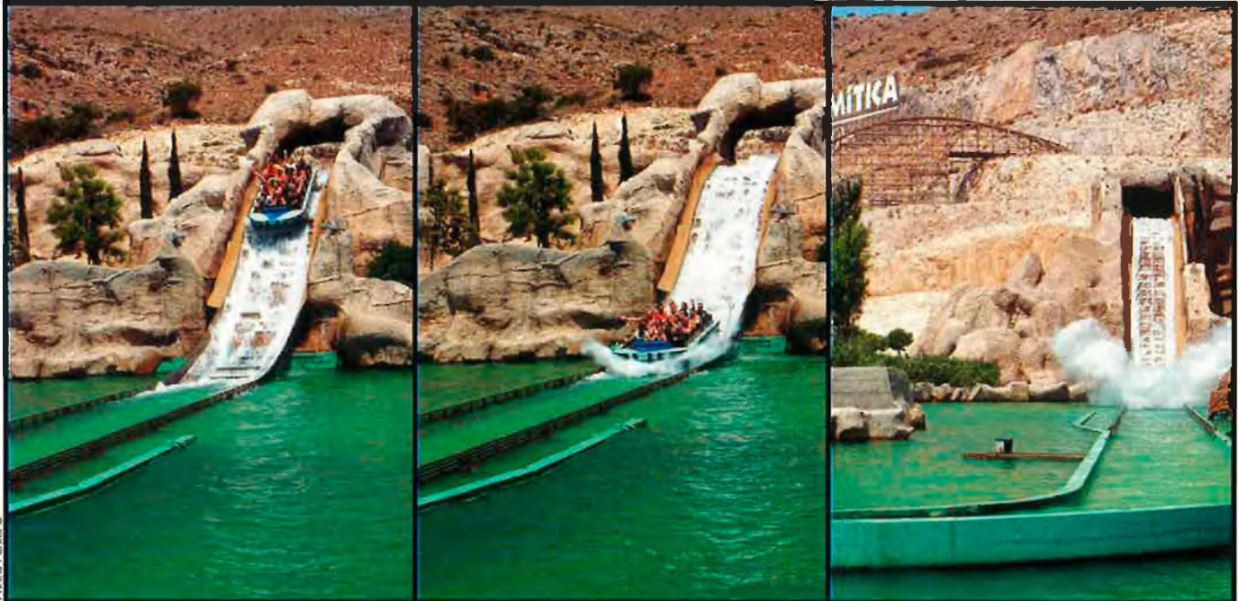
Tres escenes que representen moments estel·lars en una de les atraccions aquàtiques del parc, unes atraccions que es basen essencialment en el vertigen i la velocitat, i, tot i que ofereixen gran impacte, deixen fora aquells clients que prefereixen emocions menys intenses.

moment, Paramount és la gestora del parc, i els seus punts de vista, a banda de concretar-se en una lògica retallada de despeses de funcionament, apunten cap a un tipus de promocions un punt pretensives. De fet, Terra Mítica ha signat un acord amb una productora nord-americana, Horse Creek Productions, per gravar vídeos comercials sobre les atraccions més vertiginoses del parc. Perquè Horse Creek està especialitzada en la venda i distribució de material audiovisual per als fanàtics americans dels parcs d'atraccions.