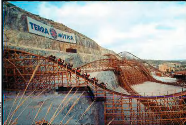
L'ambientació resulta bàsica en Terra Mítica, però ha d'enfrontar-se a la renovació constant, perquè això ho fan altres parcs, com ara Port Aventura.